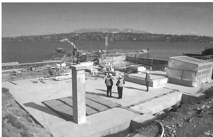
La construction de la prise d'eau dans le lac.