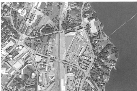
Lac nations plan sur photo.

cle. Les CFF électrifient leur réseau et une industrie de pointe s'implante et se développe en face du magnifique parc Mon-Repos, dans le quartier de Sécheron. Les décennies qui suivent sont marquées par l'affirmation toujours plus forte de la vocation internationale de cette zone, mais aussi par les conséquences négatives du pouvoir d'attraction genevois... un trafic automobile endémique traverse ce goulet d'étranglement inévitable pour entrer et sortir de Genève, avec la charge de pollution correspondante. Et lorsque l'industrie lourde s'en va progressivement, il reste un quartier en friches en quelque sorte, dont la réorganisation devra à la fois mettre en valeur les atouts verts (parcs et proximité du lac) et corriger autant que possible les insuffisances urbanistiques et environnementales.