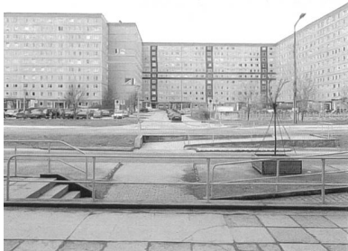
Funktionsentleerter öffentlicher Raum