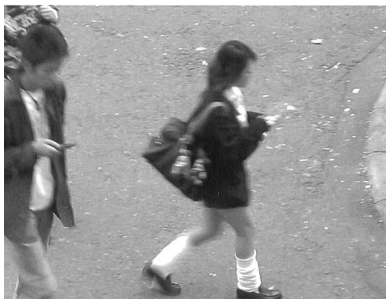
Neue Formen der Kommunikation