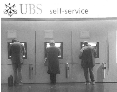
Hochspezialisierte private aber öffentlich genutzte Räume

Der Mythos des öffentlichen Raums des 19. Jahrhunderts ist allgegenwärtig. Obwohl er nur ein historisierendes Konstrukt ist, welches idealisierend wenige Aspekte herausfiltert, dient er doch als Massstab, vor dem das Stadtbild von heute nicht bestehen kann. Betrachtet man die Wunschvorstellungen sowohl geplanter wie auch gebauter zeitgenössischer öffentlicher Räume, wird klar, wie eng gerade in jüngster Vergangenheit die kollektive Vorstellung von öffentlichen Räumen mit der bürgerlichen Stadt des 19. Jahrhunderts verbunden ist. Bilder von Cafés, Boutiquen und flanierenden Menschen porträtieren eine Freizeitgesellschaft die sich in dichten und funktionsüberlagerten Räumen bewegt. Dies steht oft in Widerspruch mit den öffentlichen Räumen, die wir heute in unseren Städten vorfinden, wo der grösste Teil der Strassen und Plätze von Funktionen weitgehend entleerte Transiträume sind. In der Stadtplanung ist eine gewisse Ratlosigkeit festzustellen, in der die Planer immer mehr mit idealisierten Vorstellungen der Stadträume des 19. Jahrhunderts konfrontiert werden.