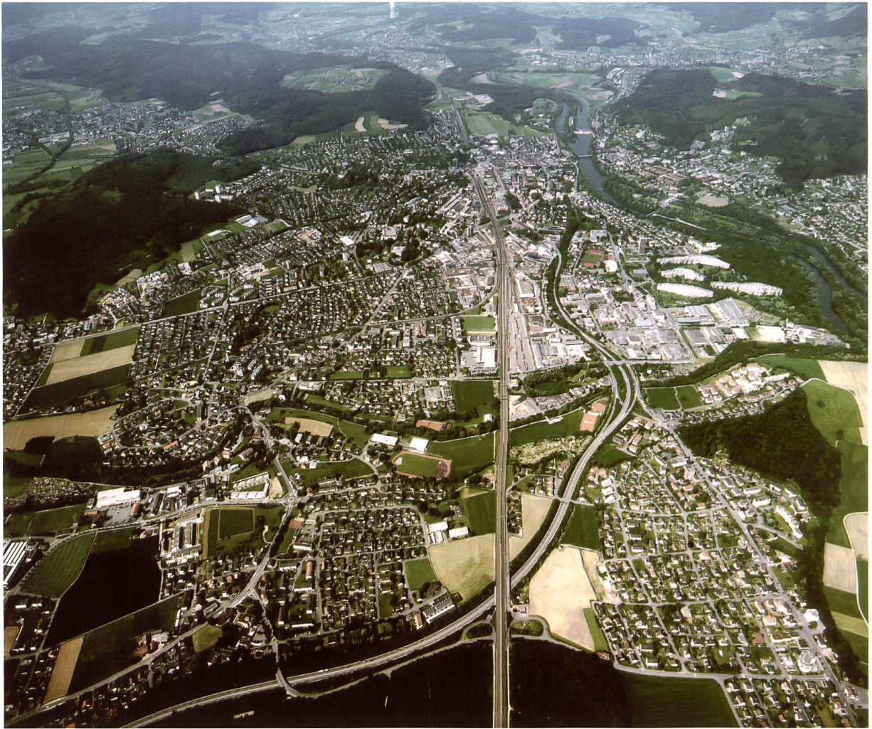
Luftbildausschnitt auf Agglomeration Aarau.

Beim Abschluss der bisherigen Phasen wurden im Rahmen von Hearings wertvolle Rückmeldungen von Gemeinde-Politikern eingeholt. Dabei wurde die Erfahrung gemacht, dass sich gerade auf kommunaler und regionaler Stufe kaum ein Politiker aus parteipolitischen Gründen offensichtlichen Erkenntnissen und zweckmässigen Vorschlägen zum Wohle der Region entziehen kann. Teilweise war es sogar für routinierte PolitikerInnen überraschend, wie sehr auf dieser unteren Stufe mit sachlich überzeugenden Argumenten plötzlich formelle Vorbehalte (Wahrung der Gemeindeautonomie etc.) weit in den Hintergrund traten. Es erweist sich fast als einfacher 19 praktisch-pragmatisch denkenden Agglomerationsgemeinden auf eine gemeinsame Perspektive «einzuschwören», als die zwei Kantone dazu zu bewegen dass sie die Agglomeration Aarau über die Kantonsgrenzen hinweg als eine Einheit behandeln.