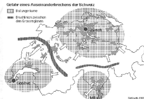
Abb. 4: Gefahr eines Auseinanderbrechens der Schweiz

Soll das politische System radikal umgebaut werden, um es den heutigen Anforderungen besser anzupassen? Dieser Versuch könnte zu einer Zer-