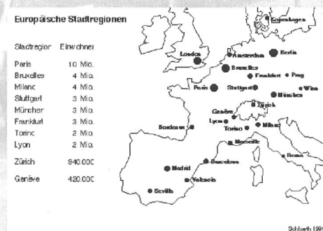
Abb. 1: Europäische Stadtregionen

Mais la situation a changé, les défis que la Suisse doit relever tant sur le plan extérieur qu'intérieur viennent battre en brèche l'efficacité du mode d'aménagement décentralisé existant.