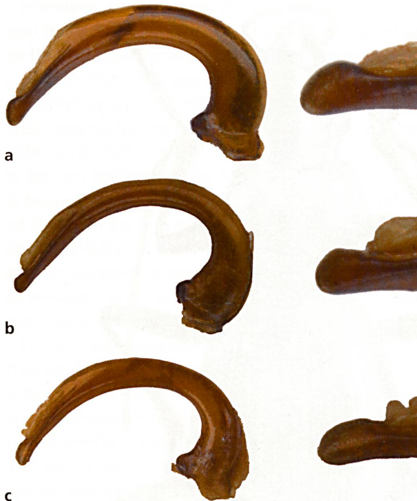
Abb. 2: Aedoeagi (a) Oreonebria angustata (DEJEAN, 1831) (b) O. soror (DANIEL, 1903) stat. nov. (c) O. soror tresignore ssp. nov. Lateralansichten. Links jeweils Medianlobus in Totalansicht, rechts die vergrößerten Spitzen. Länge der Aedoeagi 1,5 mm; Ausschnitt der Spitzenlängen 0,2 mm.

Vorkommen: Nur am Pizzo dei Tre Signori (Lombardei) an einer begrenzten Stelle an der Nordostflanke des Berges im Valle dell'Inferno auf etwa 2200 m Höhe (Abb. 3, Abb 4.).