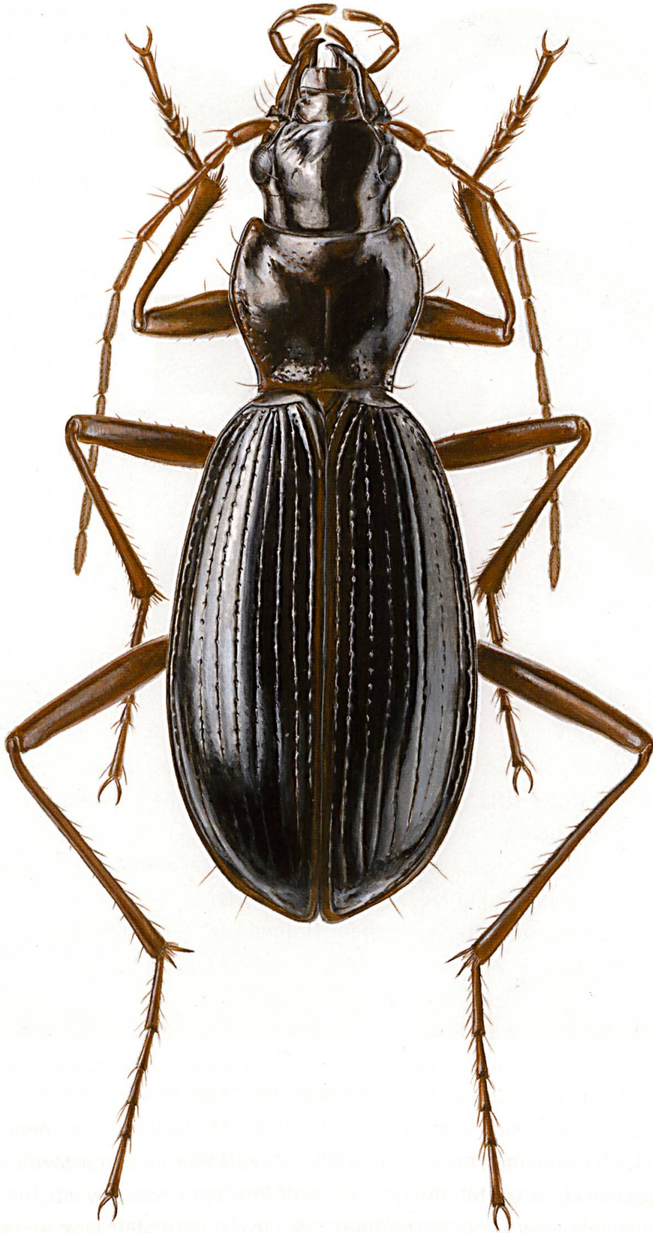
Abb. 1: Oreonebria (Oreonebria) soror tresignore ssp. nov., Holotypus, Habitus dorsal. Körperlänge: 9 mm. Zeichnung: Peter Schüle.