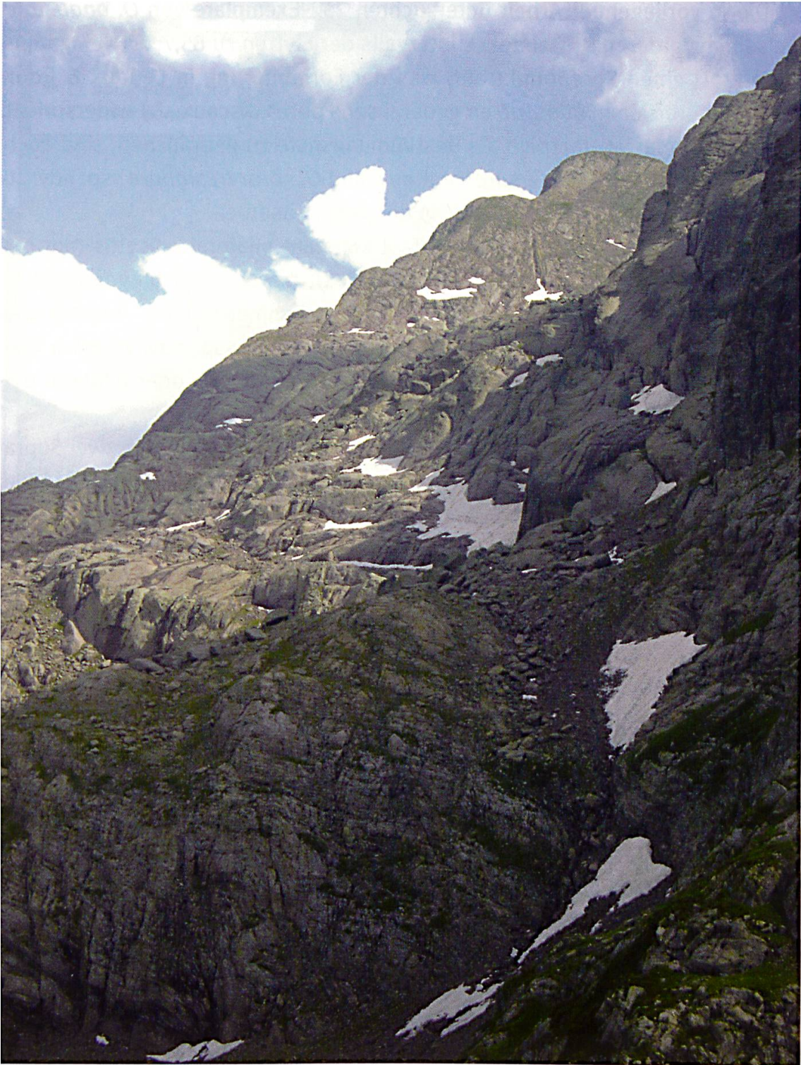
Abb. 3: Der Nordost-Abfall des Massivs vom Pizzo dei Tre Signori ins Valle dell'Inferno: Typenfundort von Oreonebria soror tresignore ssp. nov. Foto: A. Szallies, Juli 2013.

Das Pronotum ist sowohl bei O. soror stat. nov. (Daniel 1903, Ledoux & Roux 2005) als auch bei O. soror tresignore ssp. nov. in der Regel schmäler als bei O. angustata . Die Breiten des Pronotums beider Arten können sich jedoch angleichen, da es – allerdings selten – Exemplare von O. angustata mit schmalerem Pronotum gibt, die ein Breiten-/Längenverhältnis von 1,25 erreichen.