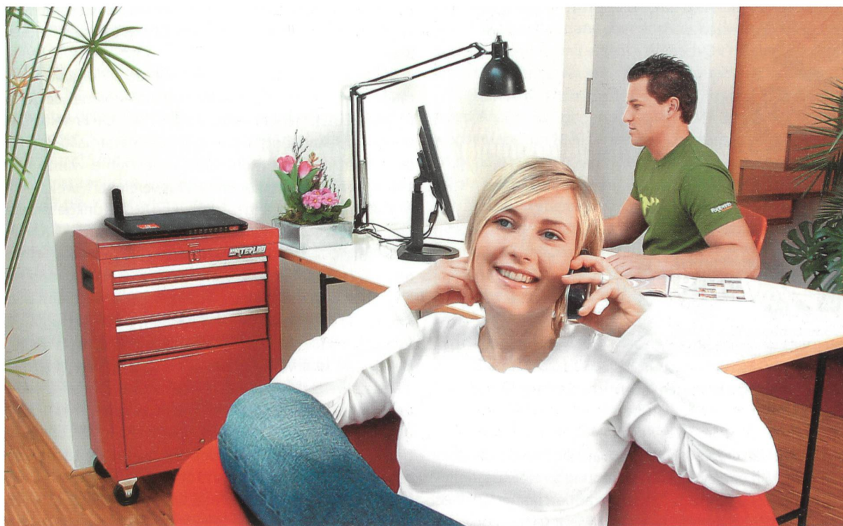
Bild 1. An die Vodafone-Box können vorhandene Festnetzgeräte wie Tisch- oder Schnurlostelefon, Faxgerät, Anrufbeantworter oder PC (per Kabel oder via WLAN) angeschlossen werden. Vodafone

bei einem Anbieter zwei Anschlüsse (mobil und fix) beziehen und folgerichtig auch zwei Abos – wenn auch zum Kombipreis – unterhalten. Ob sich hier auf der Kosten- und Aufwandseite eine positive Bilanz ergibt, ist zumindest fragwürdig. Zudem haben von BT unabhängige Tests ergeben, dass Bluephone™ wegen der geringen Sendeleistung von Bluetooth über einen beschränkten Bewegungsradius verfügt und sich nur bedingt für den Sprachverkehr eignet. Im Gegensatz zu den WLANs existieren für Bluetooth auch keine Repeater zur Verbesserung der Empfangsverhältnisse. Diese sind bei den WLANs wegen der höheren Sendeleistung ohnehin ungleich günstiger. Eine bessere Lösung könnten somit kombinierte GSM- und WLAN-Handys darstellen, die aber nicht vor Ende 2005 erwartet werden.