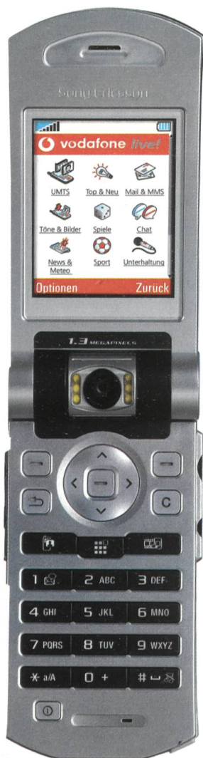
Bild 5. Sony Ericsson V800 – ein erfolgreiches UMTS-Handy mit «Vodafone-live!»-Funktionen.

ar durch die GSM Association (GSMA), der weltweit wichtigsten Vereinigung der Mobilfunkbranche, als Höhepunkt des GSM World Congress in Cannes verliehen. UMTS steht vielerorts noch mitten im Netzaufbau, bei vielen Betreibern jedoch bereits in der Bewährungsphase. Daher war es interessant zu sehen, welche Anbieter sich auf reine Netzdienste (Connectivity) beschränkten und wo eine intelligente Kombination verschiedener Übertragungstechniken bereits heute erhältlich ist. Und so waren Jury und Teilnehmer gleichermassen gespannt, welche Endgeräte und mobilen Lösungen den besten Nutzen aus den neuen Netztechnologien ziehen.