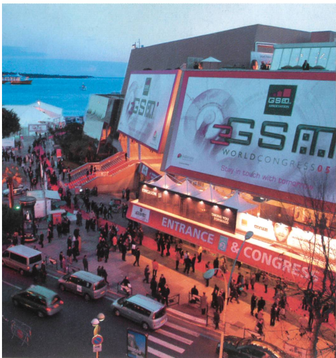
Feierliche Eröffnung des GSMA-Award.