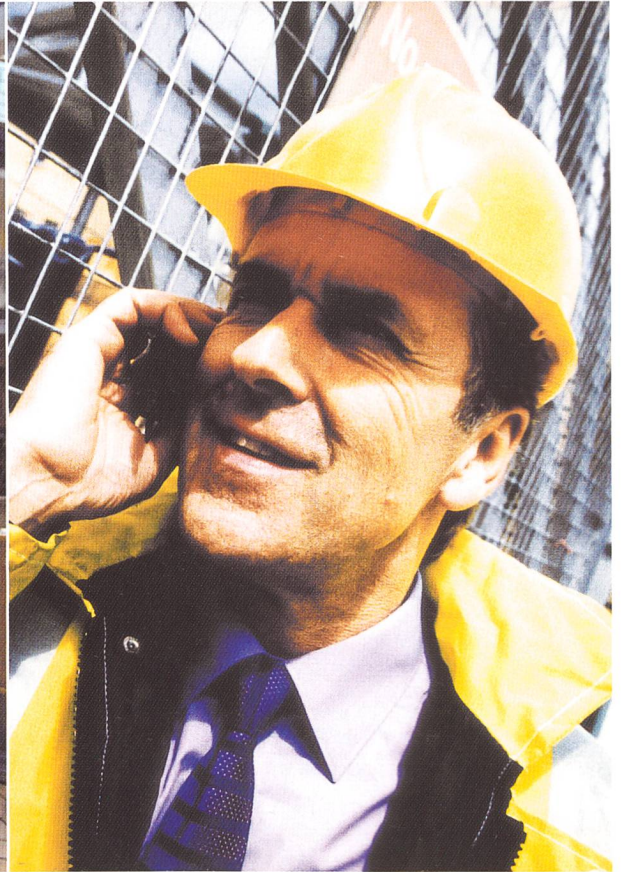
Mobiles Arbeiten draussen.

Nutzungen ermöglichen. Solche Unterschiede im Profil verschiedener Hotspots wurden im Projekt bereits bei den Beobachtungen deutlich: So können Orte unterschiedlich offen oder geschlossen sein, unterschiedliche Bequemlichkeit, Geräuschkulisse oder Atmosphäre bieten, eher privat oder eher öffentlich sein usw. Neben Orten, die eine Person aufsuchen muss – wie Bahnhöfe oder Strassen –, stehen Aufenthaltsorte, die frei gewählt werden. Und neben Orten, an denen man Zeit «sparen» will, stehen Orte, an denen es gilt, sich die Zeit zu «vertreiben». Ob und wie sich bestimmte Hotspots in das räumliche Muster des Alltags einpassen und wie sie genutzt werden, wird durch solche verschiedenen Qualitäten von Orten und Aktivitäten bestimmt und nicht allein durch die Verfügbarkeit von Technologie. Ein Hotspot etwa, der das Areal einer Fachmesse und damit einen geschlossenen Ort abdeckt, ist nur bedingt mit einem Hotspot in einem Café oder an einem Bahnhof zu vergleichen. Funktion und Nutzung eines Hotspot ist nicht nur von der technischen Infrastruktur abhängig.