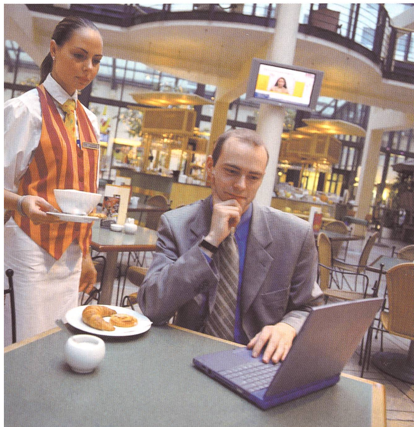
Cafés als WLAN-Hotspots. Cisco