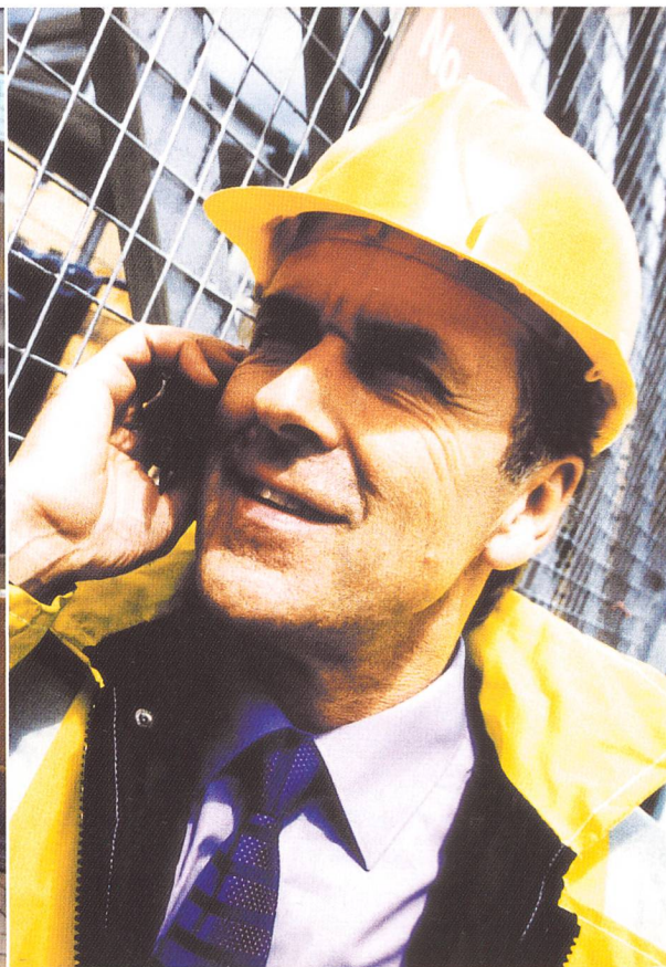
Mobiles Arbeiten draussen.

Nutzungen ermöglichen. Solche Unterschiede im Profil verschiedener Hotspots wurden im Projekt bereits bei den Beobachtungen deutlich: So können Orte unterschiedlich offen oder geschlossen sein, unterschiedliche Bequemlichkeit, Geräuschkulisse oder Atmosphäre bieten, eher privat oder eher öffentlich sein usw. Neben Orten, die eine Person aufsuchen muss – wie Bahnhöfe oder Strassen –, stehen Aufenthaltsorte, die frei gewählt werden. Und neben Orten, an denen man Zeit «sparen» will, stehen Orte, an denen es gilt, sich die Zeit zu «vertreiben». Ob und wie sich bestimmte Hotspots in das räumliche Muster des Alltags einpassen und wie sie genutzt werden, wird durch solche verschiedenen Qualitäten von Orten und Aktivitäten bestimmt und nicht allein durch die Verfügbarkeit von Technologie. Ein Hotspot etwa, der das Areal einer Fachmesse und damit einen geschlossenen Ort abdeckt, ist nur bedingt mit einem Hotspot in einem Café oder an einem Bahnhof zu vergleichen. Funktion und Nutzung eines Hotspot ist nicht nur von der technischen Infrastruktur abhängig.