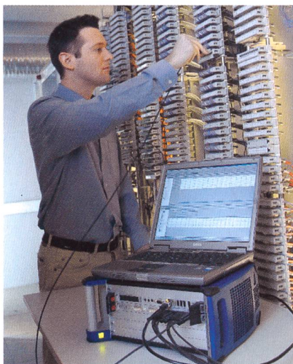
Monitoring-, Optimierungs- und Analysetools.

Info: Exanovis AG, Moosstrasse 8A, CH-3322 Schönbühl, Tel. 031 850 25 25, Fax 031 850 25 20, info@exanovis.com , www.exanovis.com