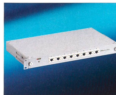
Verteilerfeld CATVsolution 862/8 von R&M