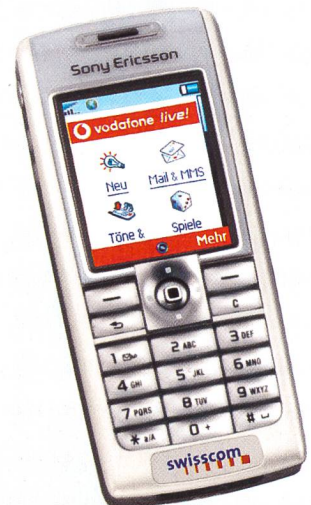
Sony Ericsson T630