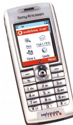
Sony Ericsson T630