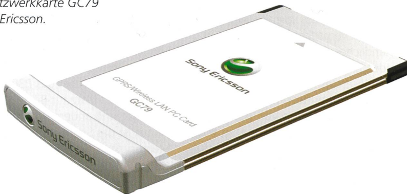
Bild 7. Netzwerkkarte GC79 von Sony Ericsson.

HSCSD und Bluetooth. Aufgrund seiner offenen Industriestandard-Protokolle und Sprachen inklusive WAP 2.0, cHTML, Symbian OS 7.0, Java, SyncML und M-Services wird das P800 zu einem vielseitigen Gerät, das eine grosse Bandbreite an Anwendungen und Programmierungen ermöglicht und an den persönlichen Nutzer adaptierbar ist.