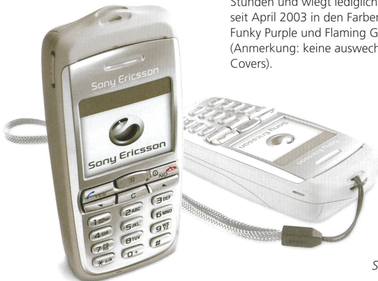
Bild 4. Sony-Ericsson-Handy T600.

stick, sondern vor allem die 32-stimmigen Soundeffekte und die Integration der Vibrationsfunktionalität, die schon fast ein mobiles Spielkonsolengefühl vermitteln. Dank der integrierten Mophun-Spieleplattform von Synergenix lassen sich weitere Spiele vom Internet herunterladen ( www.mophun.com ), wobei zurzeit etwa 50 Mophun-Games zur Verfügung stehen. Für Spass sorgen beim T310 aber nicht nur die Gaming-, sondern auch die Imaging- und Messaging-Qualitäten (über die ansteckbare Digitalkamera) sowie die MMS- und E-Mail-Funktionen. Als CommuniCam ist die MCA-25 einsetzbar, die mit dem T300 lanciert wurde und mit einem digitalen Zoom ausgestattet ist. Das T310 bietet eine Sprechzeit von bis zu 11 Stunden und eine Standby-Zeit von bis zu 400 Stunden und wiegt lediglich 79 g. Es ist seit April 2003 in den Farben Fancy Blue, Funky Purple und Flaming Gold lieferbar (Anmerkung: keine auswechselbaren Covers).