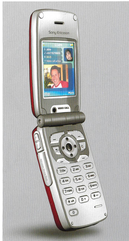
Bild 8. Erstes UMTS-Handy vom Typ Z1010 von Sony Ericsson.

Sony Ericsson stellt ausgewählten Netzbetreibern Testgeräte für das UMTS-Netz bereits seit Mitte 2002 zur Verfügung und präsentierte im vergangenen September gemeinsam mit Ericsson die ersten erfolgreichen Dual-Mode-Verbindungen mit nahtloser Übergabe zwischen UMTS- und GSM-Netzen. Diese Live-Demo eines Handovers erfolgte mit Testgeräten von Sony Ericsson auf Basis einer