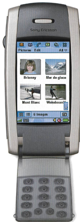
Bild 6. Sony Ericsson Smartphone P800.

kommunizieren, Pendenzen, Termine und Adressen verwalten, sondern auch digital fotografieren, Bild- oder Videosequenzen und MP3-Musik vom Internet herunterladen oder archivieren sowie verschiedene Games spielen. Diese Funktionalitäten verpackte Sony Ericsson in ein handliches Gerät mit einem ansprechenden Design, das über ein grosses, hochauflösendes Farbtouchscreen-Display mit Handschrifterkennung verfügt. Mit seiner Displaygrösse von 208×320 Pixel (40×61 mm) ohne Klappe bei 4096 Farben besitzt das P800 die zurzeit beste Bildqualität unter den Mobiltelefonen. Damit bietet es die ideale Voraussetzung, um Fotos oder Videos zu betrachten, im Web zu surfen, Spiele zu benützen oder im E-Mail angehängte Dokumente wie MS-Word-, Excel-, Powerpoint- oder Adobe-Acrobat-Dateien zu öffnen. Das P800 kann als praktischer PIM-Organizer (PIM: Personal Information Management) eingesetzt werden. Es verfügt über ein Adressbuch mit grosser Speicherkapazität sowie einen Terminkalender und ermöglicht, die Daten mit dem PC zu synchronisieren. Für Vielreisende ist der Flugzeug-Modus sicher interessant, womit der Organizer ohne Telefonfunktion genutzt werden kann und dem Anwender erlaubt, E-Mails und Kontakte zu bearbeiten, Termine einzutragen, Musik zu hören oder zu spielen. Dank der integrierten Bluetooth-Schnittstelle kann