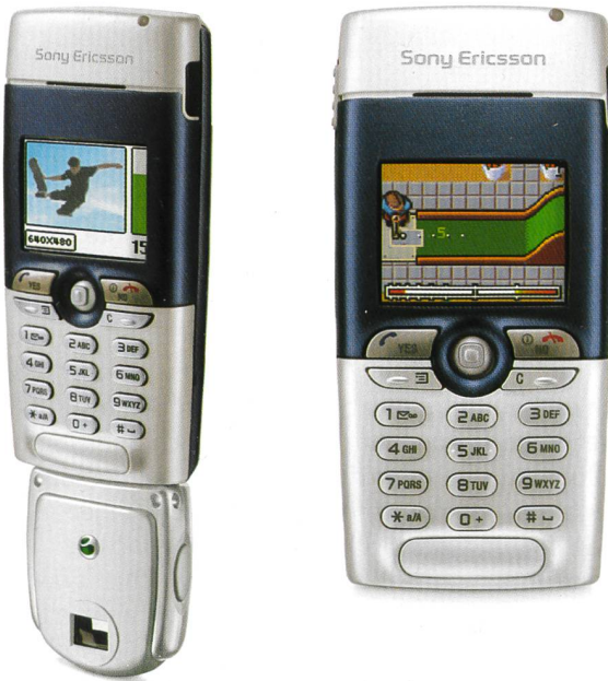
Bild 3. Sony-Ericsson-Handy-T310.