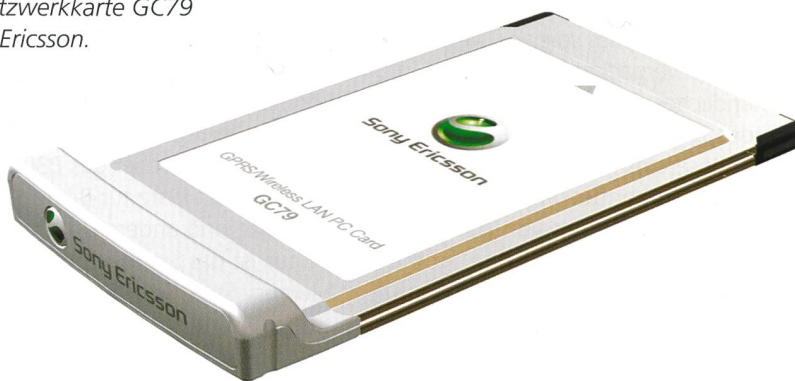
Bild 7. Netzwerkkarte GC79 von Sony Ericsson.

HSCSD und Bluetooth. Aufgrund seiner offenen Industriestandard-Protokolle und Sprachen inklusive WAP 2.0, cHTML, Symbian OS 7.0, Java, SyncML und M-Services wird das P800 zu einem vielseitigen Gerät, das eine grosse Bandbreite an Anwendungen und Programmierungen ermöglicht und an den persönlichen Nutzer adaptierbar ist.