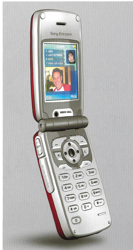
Bild 8. Erstes UMTS-Handy vom Typ T1010 von Sony Ericsson.

Sony Ericsson stellt ausgewählten Netzbetreibern Testgeräte für das UMTS-Netz bereits seit Mitte 2002 zur Verfügung und präsentierte im vergangenen September gemeinsam mit Ericsson die ersten erfolgreichen Dual-Mode-Verbindungen mit nahtloser Übergabe zwischen UMTS- und GSM-Netzen. Diese Live-Demo eines Handovers erfolgte mit Testgeräten von Sony Ericsson auf Basis einer