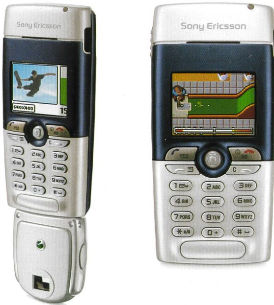
Bild 3. Sony-Ericsson-Handy-T310.