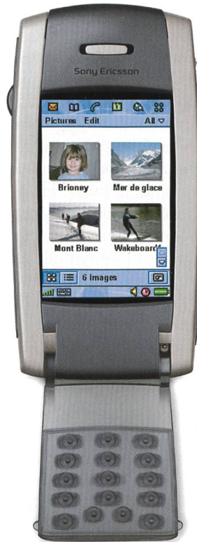
Bild 6. Sony Ericsson Smartphone P800.

kommunizieren, Pendenzen, Termine und Adressen verwalten, sondern auch digital fotografieren, Bild- oder Videosequenzen und MP3-Musik vom Internet herunterladen oder archivieren sowie verschiedene Games spielen. Diese Funktionalitäten verpackte Sony Ericsson in ein handliches Gerät mit einem ansprechenden Design, das über ein grosses, hochauflösendes Farbtouchscreen-Display mit Handschrifterkennung verfügt. Mit seiner Displaygrösse von 208×320 Pixel (40×61 mm) ohne Klappe bei 4096 Farben besitzt das P800 die zurzeit beste Bildqualität unter den Mobiltelefonen. Damit bietet es die ideale Voraussetzung, um Fotos oder Videos zu betrachten, im Web zu surfen, Spiele zu benützen oder im E-Mail angehängte Dokumente wie MS-Word-, Excel-, Powerpoint- oder Adobe-Acrobat-Dateien zu öffnen. Das P800 kann als praktischer PIM-Organizer (PIM: Personal Information Management) eingesetzt werden. Es verfügt über ein Adressbuch mit grosser Speicherkapazität sowie einen Terminkalender und ermöglicht, die Daten mit dem PC zu synchronisieren. Für Vielreisende ist der Flugzeug-Modus sicher interessant, womit der Organizer ohne Telefonfunktion genutzt werden kann und dem Anwender erlaubt, E-Mails und Kontakte zu bearbeiten, Termine einzutragen, Musik zu hören oder zu spielen. Dank der integrierten Bluetooth-Schnittstelle kann