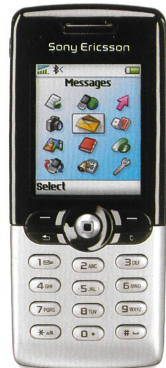
Bild 5. Sony-Ericsson-Handy T610.

mate zur Auswahl, von 80×60 Pixel bis hin zu 640×480 Pixel (entspricht einer VGA-Auflösung). Der unverbindliche Verkaufspreis beträgt Fr. 198.–.