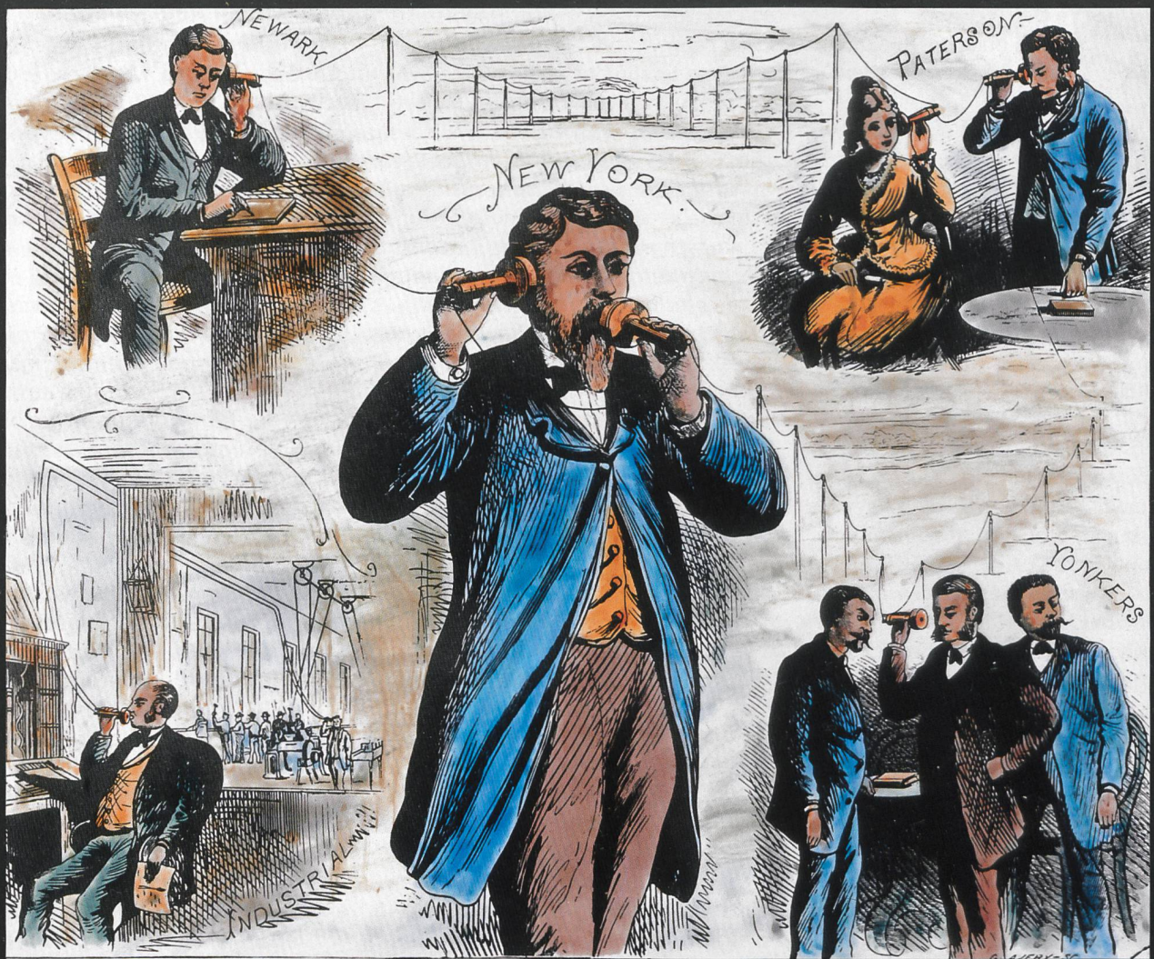
Stich von 1877, Bearbeitung und Kolorierung H. R. Bramaz, Zürich.

Graham Bells Telefon. 1876 war ein bemerkenswertes Jahr in der Geschichte der Erfindungen. Anlässlich der 200-Jahr-Feier zur Gründung der USA wurde in Philadelphia eine Weltausstellung durchgeführt. An dieser galt das Telefon von Graham Bell als die herausragendste Erfindung.