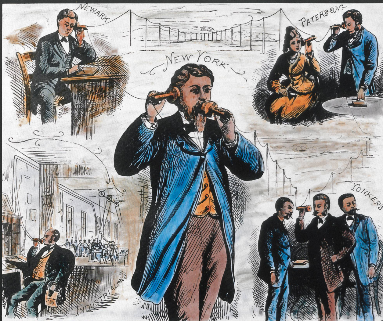
Stich von 1877, Bearbeitung und Kolorierung H. R. Bramaz, Zürich.

Graham Bells Telefon. 1876 war ein bemerkenswertes Jahr in der Geschichte der Erfindungen. Anlässlich der 200-Jahr-Feier zur Gründung der USA wurde in Philadelphia eine Weltausstellung durchgeführt. An dieser galt das Telefon von Graham Bell als die herausragendste Erfindung.