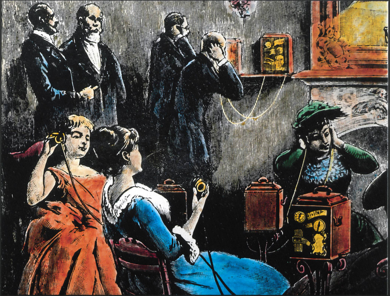
Ein «Theaterphon» in der Lobby eines Hotels in Paris. Stich von 1893, Bearbeitung und Kolorierung H. R. Bramaz, Zürich.

Beim «Theaterphon» handelt es sich um eine Entwicklung von Ader, bei der erstmals links und rechts der Bühne Mikrofone installiert und entsprechend auf die Telefon-Hörmuscheln übertragen wurden. Damit konnte ein Stereoeffekt für Tonübertragungen erzielt werden.