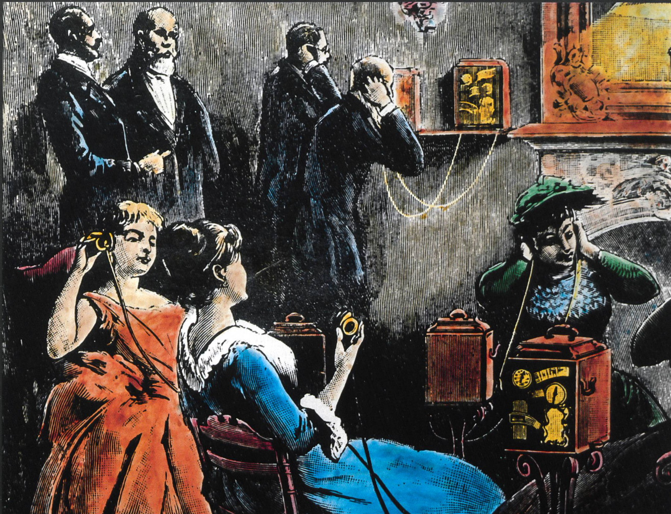
Ein «Theaterphon» in der Lobby eines Hotels in Paris. Stich von 1893, Bearbeitung und Kolorierung H. R. Bramaz, Zürich.

Beim «Theaterphon» handelt es sich um eine Entwicklung von Ader, bei der erstmals links und rechts der Bühne Mikrofone installiert und entsprechend auf die Telefon-Hörmuscheln übertragen wurden. Damit konnte ein Stereoeffekt für Tonübertragungen erzielt werden.