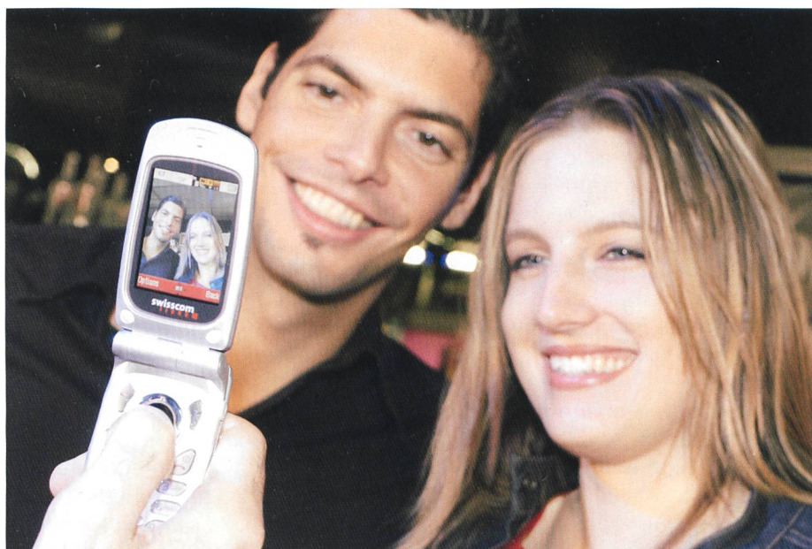
Bild 2. Mit dem Sharp GX20 lassen sich die Multimediasdienste von Vodafone-live! perfekt nutzen.

Als erster Mobilfunkanbieter in der Schweiz bietet Swisscom Mobile die Möglichkeit, mit dem Handy Fotos zu schiessen und diese als Postkarte an jede Postadresse weltweit innerhalb weniger Tage zu verschicken. Die geschossenen Bilder lassen sich mit Ton und Text versehen und natürlich auch als MMS auf ein anderes MMS-fähiges Handy oder an E-Mail-Adressen verschicken. Alle Foto-Handys von Vodafone-live! verfügen über eine integrierte Kamera. Mit dem Sharp GX20 lässt sich ein Objekt sogar zoomen oder im Makromodus von ganz nahe fotografieren. Mithilfe des über Web oder Handy zugänglichen MMS-Albuns können persönliche Bilder sicher abgespeichert und jederzeit mit dem Handy wieder aufs Farbdisplay abgerufen oder auf den PC-Bildschirm geholt werden. Das Album lässt sich mit eigens angelegten Ordnern praktisch verwalten. Das Angebot an Content und Services ist eine attraktive Mischung von globalen Topbrands (Simpsons, Ferrari Monte Carlo, UEFA, James Bond, Tomb Raider