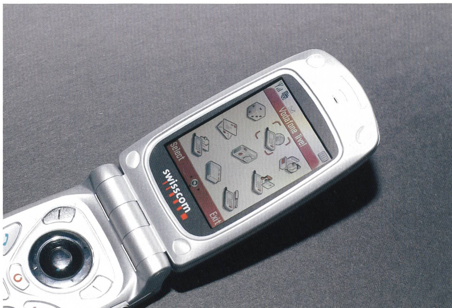
Bild 1. Handy Sharp GX20.

Töne: Eine Bandbreite von bis zu 16 Stimmen, verschiedenste Akustikeffekte und eine unvergleichliche Tonqualität sorgen dafür, dass das Handy wirklich einen persönlichen und individuellen Klang bekommt. Auf den Vodafone-live!-Handys sind verschiedene Rufmelodien voreingestellt. Darüber hinaus kann der Kunde Musikstücke in verschiedenen Kategorien auswählen – von Top-10-Songs, über aktuelle Neuheiten bis hin zu genrespezifischen Stücken aus Rock und Pop.