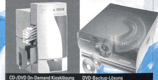
CD-/DVD On-Demand Kiosklösung