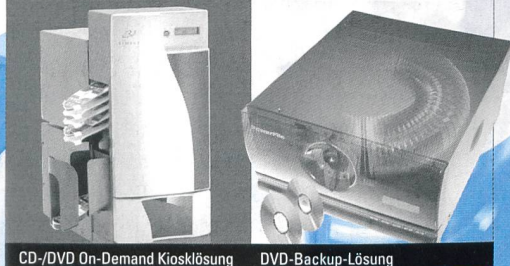
CD-/DVD On-Demand Kiosklösung