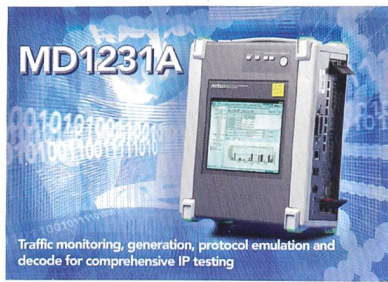
Traffic monitoring, generation, protocol emulation and decode for comprehensive IP testing