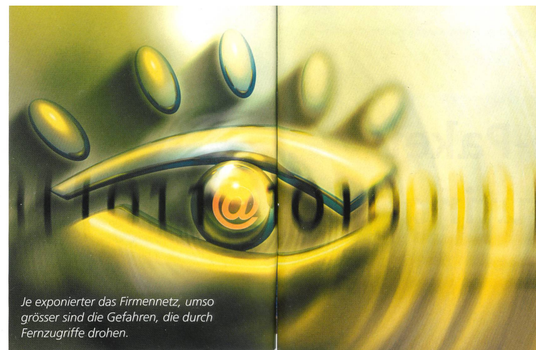
Je exponierter das Firmennetz, umso grösser sind die Gefahren, die durch Fernzugriffe drohen.

Im Prinzip ist das technisch alles kein Problem: Auf dem Markt gibt es eine Vielzahl von entsprechenden Lösungen. Trotzdem ist die Aufgabe in der Praxis alles andere als trivial – vor allem, wenn die Sicherheitsausrüstung von unterschiedlichen Anbietern stammt. Solche heterogene Systeme sind komplex, teuer und schwer zu managen. Gewitzt durch negative Erfahrungen, setzt sich bei den Anwendern langsam die Erkenntnis durch, dass auf dem Gebiet der WLAN-Sicherheit integrierte Lösungen vorzuziehen sind. Inzwischen haben das auch die Gremien erkannt, die für die Standardisierung der Telekommunikation zuständig sind. Das Resultat: In Zukunft sollen zwei neue Funknetz-Standards (802.11i und 802.1x) für mehr Sicherheit sorgen. Mit diesen wären dann aufwändige Mass-