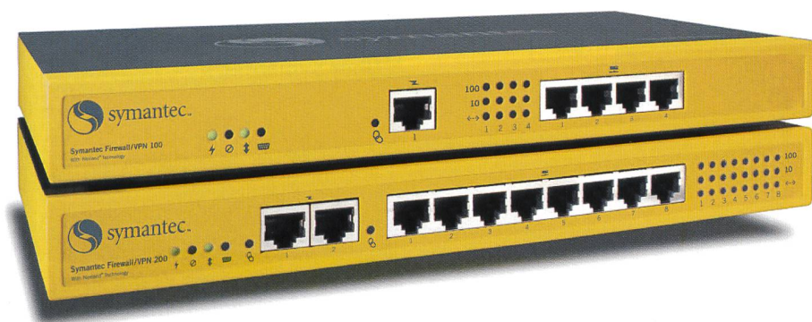
Bild 1. Symantec präsentiert die neuen Firewall-Systeme Symantec Firewall/VPN 100, 200 und 200R. Jedes der neuen Systeme integriert Firewall, VPN und die Vernetzung mit weiteren Fähigkeiten in einem kompakten Gerät, um speziell den Anforderungen von Telearbeitsplätzen, Unternehmensfilialen und kleinen Unternehmen gerecht zu werden.

erhält eine schlüsselfertige Lösung aus einer Hand wie beispielsweise die Symantec Veloci Raptor, eine integrierte Firewall/VPN-Lösung. Was zu tun bleibt, ist die Anpassung der Filterregeln an die spezifischen Erfordernisse des konkreten Einsatzbereichs. Hierdurch wird nicht nur eine erhebliche Menge an Arbeitszeit gespart, man verringert auch das Risiko, durch Fehler bei der Installation Sicherheitslücken zu schaffen, die im Nachhinein schwer zu schliessen sind. Stellt sich später heraus, dass eine Appliance eine Sicherheitslücke aufweist, kann diese durch Einspielen eines Firmware-Updates beseitigt werden. Hierbei ist man allerdings auf den Hersteller angewiesen, der ein solches Update bereitstellen muss. Die herstellereitige Anpassung auf ein bestimmtes Anwendungsszenario, das zum Beispiel die Art der Internet-Anbindung (Wählverbindung, DSL, Standleitung) oder die Anzahl der Benutzer umfassen kann, bringt den Nachteil einer geringeren Flexibilität mit sich, wenn sich das Szenario wesentlich verändert. Genügt der Durchsatz nicht mehr den gestiegenen Anforderungen, weil sich die Anzahl der Benutzer deutlich erhöht hat und man diese Möglichkeit bei der Anschaffung nicht ausreichend berücksichtigt hat, kann man in vielen Fällen die Last auf eine oder mehrere weitere Appliances verteilen.