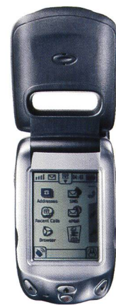
Bild 8. Motorola A388 (Dieses Handy ist für den asiatischen Markt vorgesehen und wird daher in der Schweiz nicht erhältlich sein).