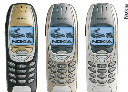
Bild 3. Nokia 6310.