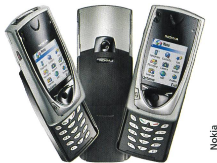
Bild 4. Nokia 7650.

eingebaute Bluetooth-Schnittstelle kein Profil zur Unterstützung von Bluetooth-fähigen Freisprecheinrichtungen (wie das etwa bei den besseren Handys von Ericsson üblich ist). Weitere Infos sind unter den Homepages www.nokia.com/phones/7650/index.html (Nokia 7650) und www.sun.com/products/midp (Sun MIDP) abrufbar.