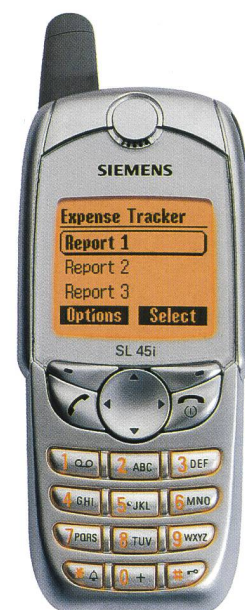
Bild 1. Siemens SL45i.

Microsystems führte Anfang 2000 zu einem ersten Entwicklungsauftrag, bei dem ein SL35 modifiziert und mit ersten J2ME-Funktionalitäten erweitert wurde. Mit dem SL45i (Bild 1) brachte Siemens im Oktober letzten Jahres das erste kommerziell verfügbare GSM-Java-Handy der Welt auf den deutschen Markt. Für Siemens war dies Grund genug, ein in Telekommunikationskreisen eher ungewöhnliches Partnerschaftsprogramm vorzustellen: «Early Bird» bietet allen interessierten Programmierern die Möglichkeit, ihre Entwicklungsideen in mobile Java-Anwendungen umzusetzen. Programme mit guten Marktchancen, die mittels «Early Bird» entwickelt werden, erhalten durch Siemens ICM volle Unterstützung bis zur Marktreife. Die Online-Vertriebskanäle von Siemens können zur Markteinführung dieser Programme ebenso genutzt werden wie die Möglichkeit zur Kontaktaufnahme mit den Netzbetreibern. Nach der Online-Registrierung im «Developers Village» (Homepage: www.siemens.com/mobile-partners ) werden die Interessenten automatisch Mitglied der Siemens-Entwicklergemeinschaft und erhalten ein «Early Bird»-Paket zu sehr günstigen Konditionen. Die-