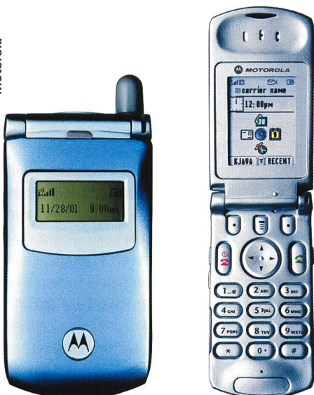
Bild 6. Motorola T720, offen und geschlossen.