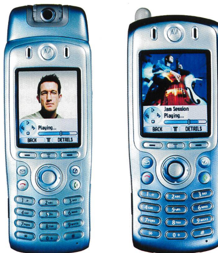
Bild 7. Motorola A820, mit und ohne eingebauter Kamera.