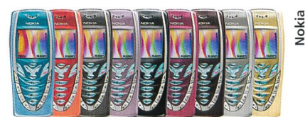
Bild 2. Verschiedene Ausführungen des Nokia 7210.