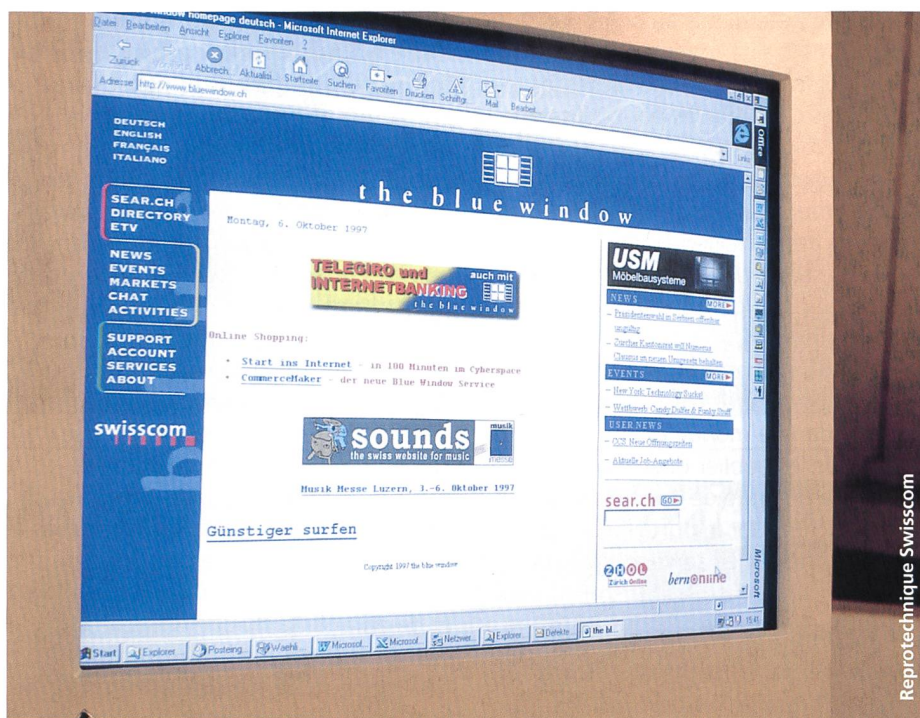
La petite entreprise multimédia «the blue window» s'est hissée au rang de principal fournisseur suisse d'accès à l'internet, connu aujourd'hui sous le nom de «Bluewin».

l'accès à l'internet, Bluewin s'était déjà distinguée de la concurrence en mettant l'accent sur la simplicité de ses services. La filiale de Swisscom a ainsi été l'un des premiers fournisseurs mondiaux à permettre à ses clients d'installer et de configurer eux-mêmes leur accès à l'internet. Alors que certains internautes ont dû se fatiguer à installer sous Windows une liaison d'accès à distance, les clients de Bluewin n'ont eu qu'à insérer le CD-ROM BlueDisk, qui ne nécessite toujours aucun paramétrage. En outre, l'utilisateur a la possibilité de modifier en ligne les informations concernant son compte, en ajoutant par exemple des adresses e-mail supplémentaires à l'aide du navigateur. La taille du premier fournisseur suisse de services internet présente également des avantages en matière de service à la clientèle: le centre d'appels de Bluewin emploie 63 agents capables de résoudre les problèmes des clients par téléphone en trois à quatre minutes en moyenne. Sur le marché de l'accès à l'internet, l'avenir appartient aux fournisseurs qui misent sur le confort d'utilisation plutôt que sur la technologie. S'agissant du marché de masse, les exigences des clients portent non seulement sur la qualité et la simplicité des services proposés mais aussi sur leur adaptabilité. Ainsi, au-delà de la prestation elle-même qui doit être de qualité, le client accorde une