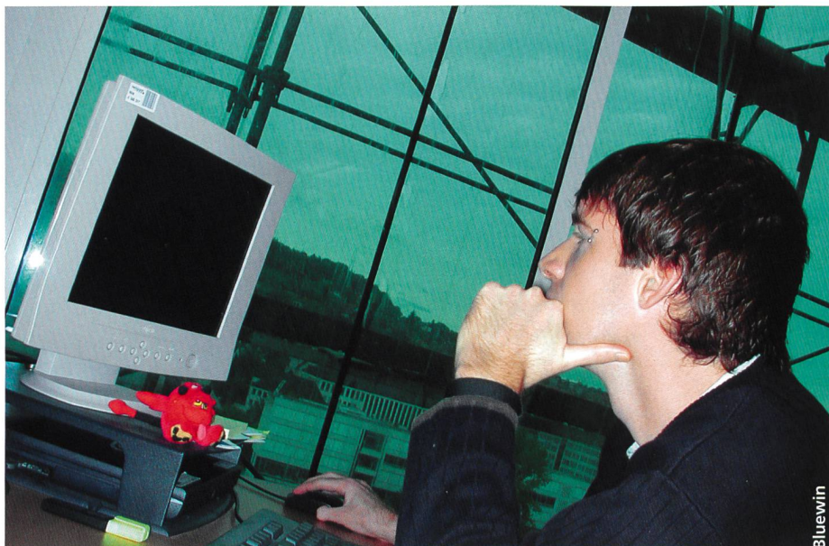
L'un des quelque 300 collaborateurs de Bluewin installés dans la «Blue Tower» en verre de Zurich.