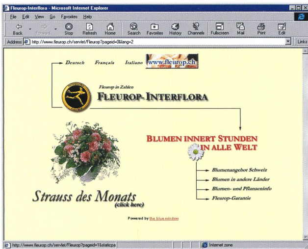
Bild 2. Bestellung des Blumenstrausses per Internet.

vergessen, müssen Sie einen Besuch absagen oder wollen Sie jemanden einfach so beschenken? Alles Situationen, die nach einem spontanen Zugriff zum Internet rufen. Mit dem WAP-Handy haben Konsumentinnen und Konsumenten in reduzierter Form (reduced to the max) Zugriff aufs Web und damit zu E-Commerce.