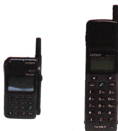
Sony CMD-Z1, CMDX1000 (das CMDX1000 ist bau- gleich zum Siemens S4)

Geeignet für alle Telekommunikations- standards und Kommunikationsarten