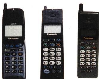
Panasonic G350, G400, G500