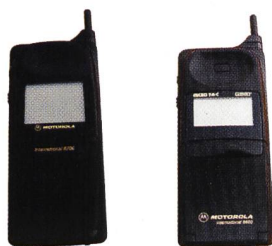
Motorola Flare, 8200, 8400, 8700

Das MC218 ist einsetzbar mit folgenden GSM Mobiltelefonen