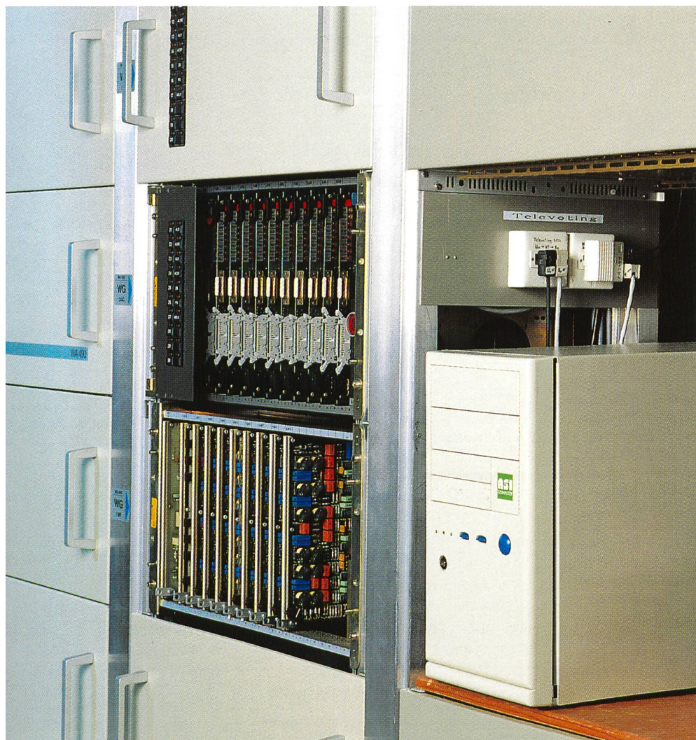
Fig. 6. Collettore TeleVote.

Hansruedi Sidler , caposervizio tecnico, Telecom PTT, direzione di Lucerna