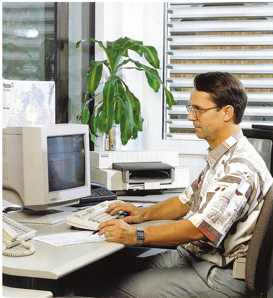
Fig. 7. Stazione di comando (BS).