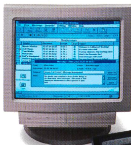
Ascom Call Center

Alle reden von neuen Arbeitsmodellen. Wir reden von der 168-Stunden-Woche.