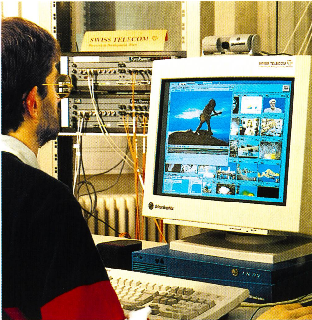
Videoapplikation über ATM