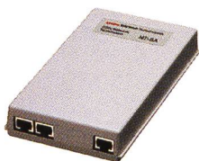
Für den Anschluss von ISDN-Geräten ans EuroISDN/SwissNet: NT-BA, Swiss Telecom Art. Nr. 312.002.9

NT+2a/b vereint die Funktionen eines ISDN-Netzabschlussgerätes und eines Terminaladapters für analoge Geräte. Es können also zum Beispiel bis zu sechs ISDN-Endgeräte, ein Fax Gruppe 3 und ein herkömmliches Schnurlos-Telefon an das gleiche Gerät angeschlossen werden. Ihr Benefit: Betriebliche Vereinfachungen verbunden mit signifikanten Kostenvorteilen.