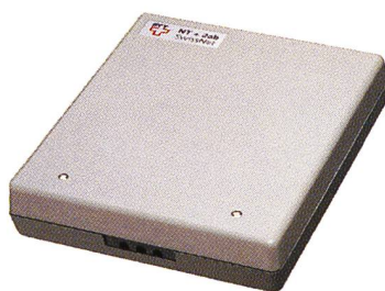
Für den Anschluss von ISDN- und Analog-Geräten ans Euro-ISDN/SwissNet: NT+2a/b, Swiss Telecom Art.Nr 212.016.0