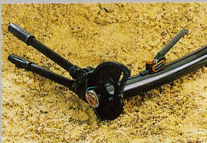
Kabelschneider KT 80 und Abmantelwerkzeug AM-X von Weidmüller zum Bearbeiten von Kabeln mit grossem Querschnitt

Carl Geisser + Co Industriestrasse 7 CH-8117 Fällanden Tel. 01 825 11 61, Fax 01 825 52 40