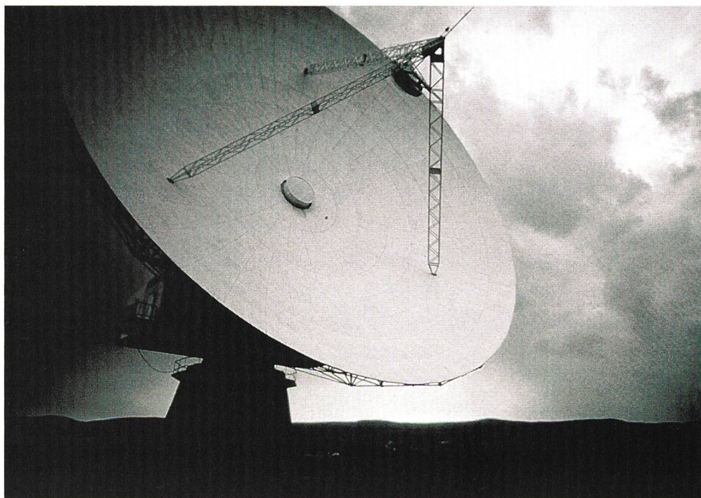
Fig. 1 Lorsqu'il s'agit d'améliorer rapidement une liaison d'un point à un autre, la communication par satellite revêt une importance croissante

Aujourd'hui, le débat sur la Société de l'information s'articule autour de la mise en œuvre du plan d'action