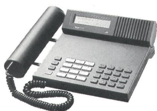
Das formschöne Brigit 100 mit Lautsprecher, Display und Message-Anzeige für wirtschaftlichen Telefonkomfort.

Für Unternehmer, die mit Teamwork gross werden. Ascoline.