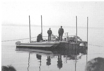
Fig. 4 Verlegefloss

Wie Charles Brasey, stellvertretender Fernmeldedirektor, ausführte, haben die Seekabel eine lange Geschichte. Bereits