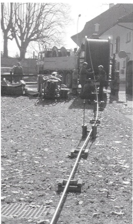
Fig. 3 Abrollen des Kabels

ganze Kabel, auch die «Landlänge», aufs Wasser. Anschliessend führten Taucher das Kabelende auf der Seite von Môtier in das Schutzrohr ein, worauf es bis in die Zentrale eingezogen und dort mechanisch gesichert werden konnte. Nach Entleeren und Entfernen der Schwimmer, beginnend bei Môtier, versenkte man das Kabel nach und nach in seine endgültige Lage am Seegrund. In der letzten Phase musste es auch noch auf der Seite von Meyriez in das Schutzrohr eingeführt und bis zum Kabelschacht eingezogen werden.