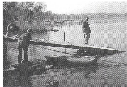
Fig. 5 Kabeleinlauf in den See

In der Region Vully zählte man 1895 fünf Lokalbatterie-Telefone. Sie waren im Kaufladen oder im Wirtshaus der Orte Lugnorre, Môtier, Nant, Praz und Sugiez