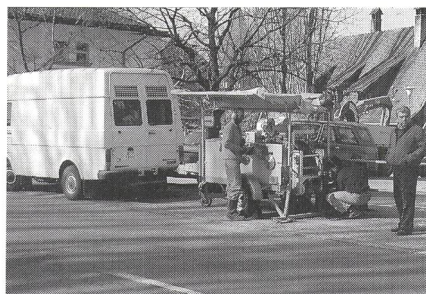
Fig. 6 Kabelverlängerung Meyriez-Murten

Mit dem Einzug der Digitalisierung haben die herkömmlichen Kabel, gebaut für die Verbindung von Zentralen auf analogem Weg, ausgedient. Neue Dienste wie Videokonferenz, Breitband-Datenverbindungen, Anschlüsse an das dienstintene