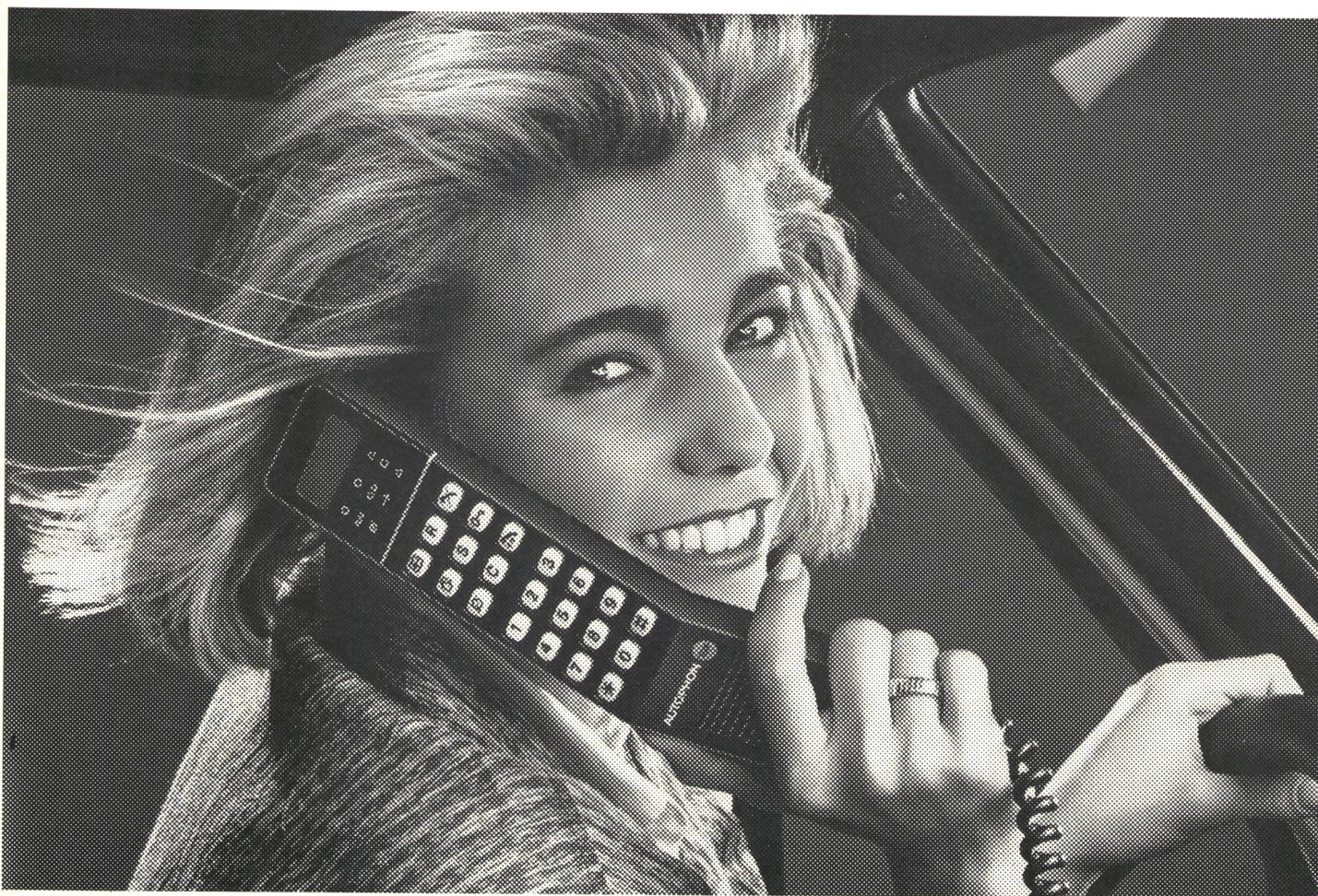
Commander C, das Telefon, das mit Ihnen aus dem Wagen steigt.