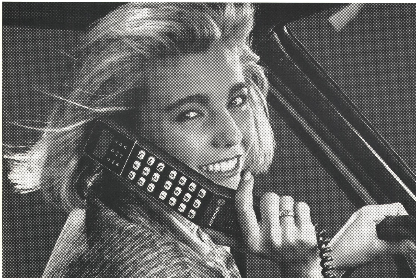
Commander C, das Telefon, das mit Ihnen aus dem Wagen steigt.