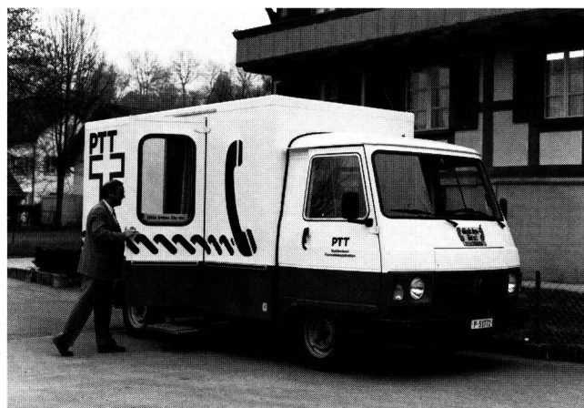
Fig. 2 Fahrbarer «Kundendienst» – Bureau itinérant

Une batterie d'accumulateurs de 24 V, indépendante de celle du véhicule, est incorporée à celui-ci et assure l'alimentation en énergie pour l'éclairage, la présentation des appareils et la ventilation; elle est combinée avec un dispositif de chauffage complémentaire programmable diesel. De plus, des vasistas et des lucarnes aménagés dans le toit du véhicule permettent une aération plus poussée.