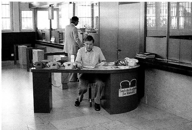
Fig. 1 Zeitweilige Beratungsstelle in Liestal – Bureau temporaire de conseil à la clientèle à Liestal

schalterhallen, Schulhäusern und Gaststätten, betrieben. Auch diese zeitweiligen Beratungsstellen werden von der Bevölkerung geschätzt und rege benutzt (Fig. 1).