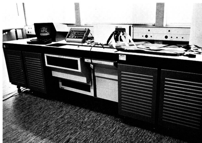
Fig. 3 Testsystem Gen Rad 1796 – Système de test Gen Rad 1796