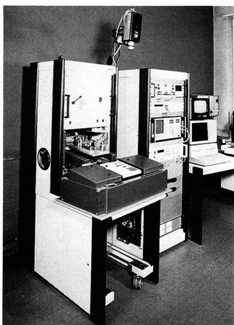
Fig. 2 Testsystem TIM – Système de test TIM

Gemäss [1] sind die Lieferanten für die Erstellung, Betreuung und Verbesserung sämtlicher Reparaturunterlagen einschliesslich der Prüfprogramme verantwortlich.