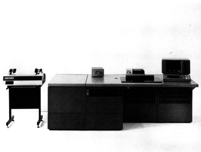
Fig. 4 Testsystem Membrain 7776 – Système de test Membrain 7776