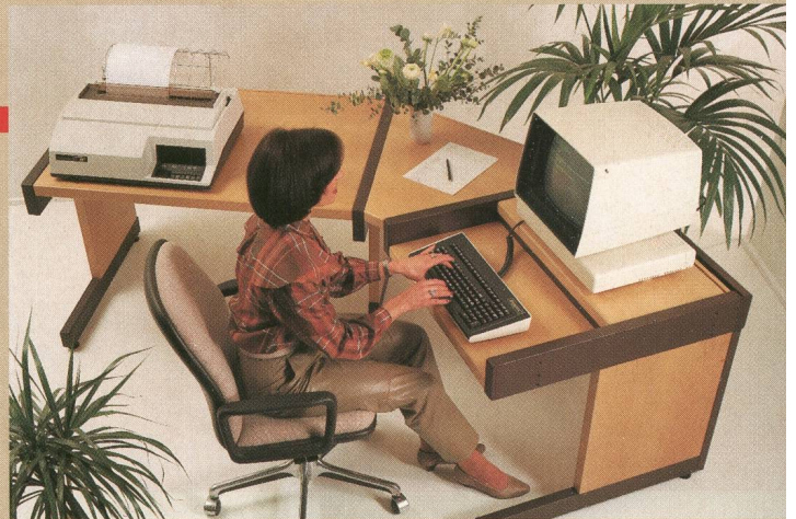
Arbeitsplatz Comatek 2003 für «effiziente Meldungsbearbeitung»