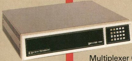
Multiplexer Gen-Net 1262