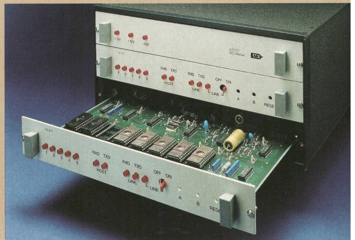
Mikrocomputer-Telecom-IF Serie 3 und Serie 4