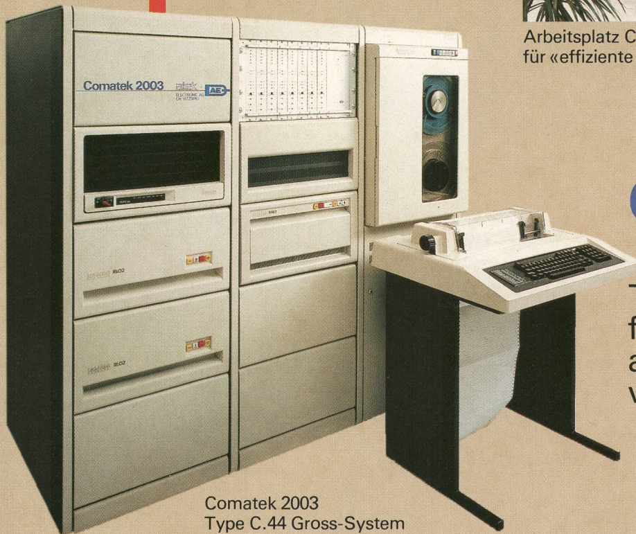
Comatek 2003 Type C.44 Gross-System