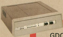
GDC Data Comm Modem