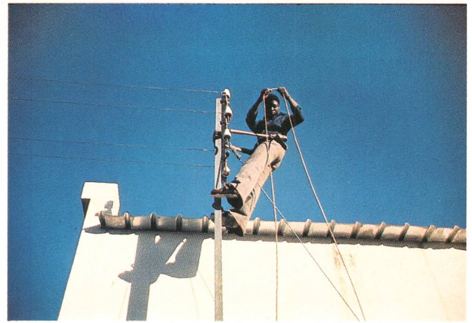
Ausbau eines oberirdischen Leitungsnetzes Extension d'un réseau de lignes aériennes Extension of overhead lines

satz der Apparate für Kabelfehlerengrenzungen.