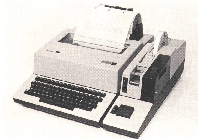
Fig. 3 Der für Datex 300 modifizierte Hasler-Fernschreiber SP300 MSR 16.

Die Übertragungseigenschaften von Datenendgeräten (DEE) für Start/Stop-Betrieb sind in der CCITT-Empfehlung