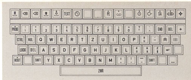
Fig. 4 Tastatur des Datex-300-Blattschreibers

lung S. 31 festgelegt. Für den Versuchsbetrieb haben die PTT-Betriebe den elektronischen Fernschreiber Hasler SP300 Typ MSR 16 eingesetzt (Fig. 3). Dieser Blattschreiber hat einen Speicher mit einer Kapazität von 16 K Zeichen und entspricht der CCITT-Empfehlung S.30. Der Schriftsatz umfasst 95 Zeichen nach den Spalten 2 bis 7 der Codetabelle des CCITT-Alphabets Nr. 5. Je Zeile können 80 Zeichen gedruckt werden, was die Verwendung von 250 mm breiten Papierrollen erfordert.