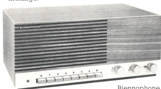
Biennophone le télédiffuseur de grande classe.