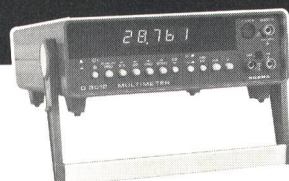
D-3012 Hochgenaues Digital-Multimeter, 28 000 Digit LED, Messbereiche bis 2 kV/20 A, BCD-Ausgang (Option)