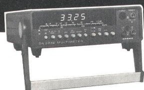
DA-3232 True-rms-Multimeter mit 3000 Digit LED und Leuchtband-Anzeige Messbereiche bis 2 kV 20 A, Akku/Netz