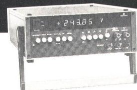
D-4025 Hochgenaues System-Multimeter, 28 500 Digit LED, IEEE-Bus D-4045 in true-rms-Ausführung