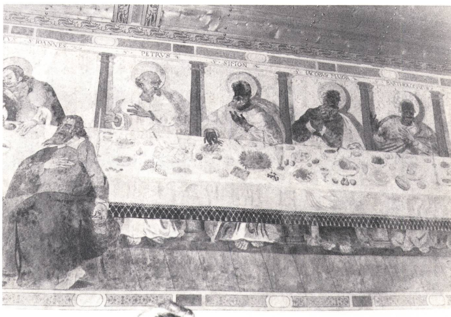
Im Anschluss an die Feier bot sich den auswärtigen Teilnehmern Gelegenheit, die kürzlich kunstvoll restaurierte alte Kirche von Falera mit ihrem mittelalterlichen Abendmahl-fresko (unser Bild) unter kundiger Erläuterung von Herrn Pfarrer Berther zu besichtigen

Der feierliche Anlass wurde mit der Besichtigung einer kleinen Ausstellung abgeschlossen.