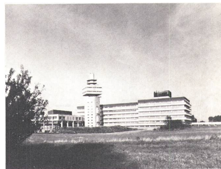
Das Forschungszentrum von British Telecom in Martlesham, Ostengland

Ein grosser Teil dieser Arbeiten hat dazu geführt, dass British Telecom heute eine anerkannte Führungsrolle auf dem Gebiet der optischen Übertragung innehat.