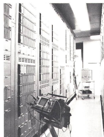
T202-Telexzentrale: Gestellreihe mit Prozessoren

Ein aufschlussreicher Rundgang durch die neuen Anlagen beschloss die Informationskonferenz.