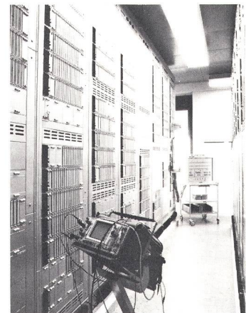
T202-Telexzentrale: Gestellreihe mit Prozessoren

Ein aufschlussreicher Rundgang durch die neuen Anlagen beschloss die Informationskonferenz.