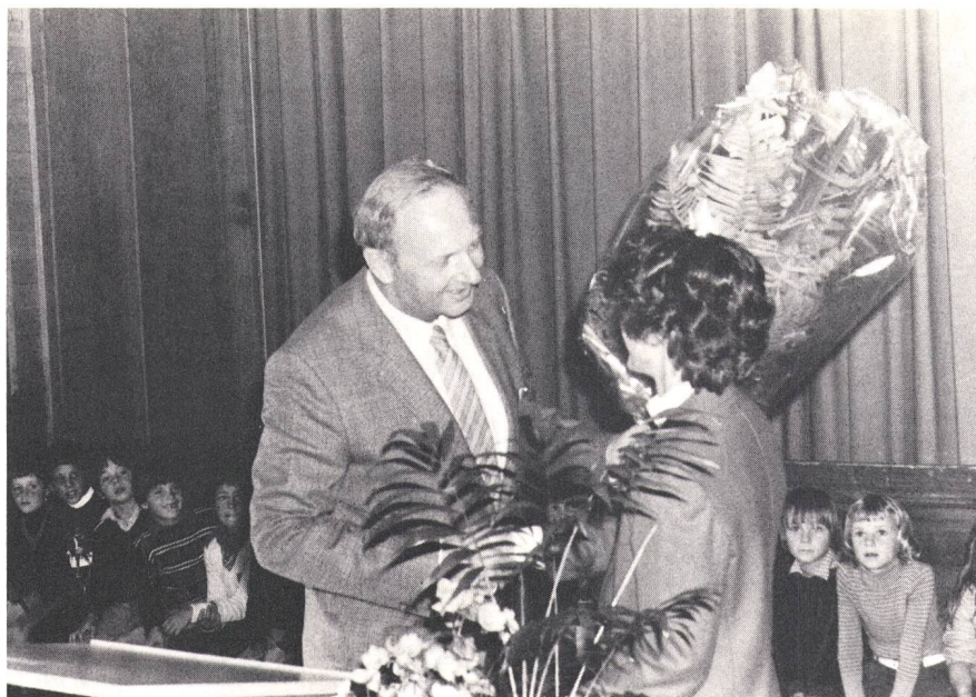
Sichtlich aufmerksam verfolgten die Schüler von Falera die Übergabe der Geschenke an die dreimillionste Telefonabonnentin aus ihrem Dorf