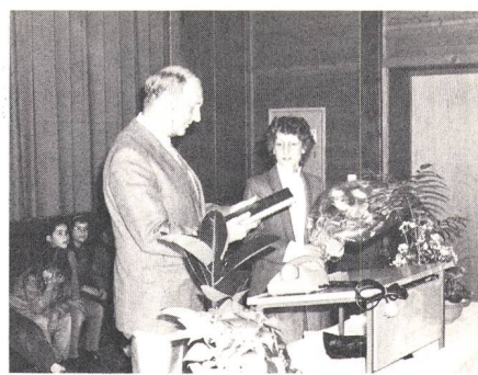
Generaldirektor Trachsel kam nicht mit leeren Händen nach Falera: Er überreichte der Jubilarin ein persönliches Tastenwahltelefon mit Gravur und ein in Leder gebundenes Bündner Telefonbuch mit Widmung (unser Bild). Ferner wird ihr für drei Jahre ein Gratisabonnement erteilt, und sie hat für 200 Franken Gespräche frei

Franken. Weiter erwähnte der Redner den geplanten Bau eines Glasfaser-Ortsnetzes für Breitbandkommunikation in Marsens im Kanton Freiburg. Dies alles diene dem Ziel, die PTT an der Spitze der Fernmeldetechnik zu halten, was für die schweizerische Fernmeldeindustrie von lebenswichtiger Bedeutung sei. Dies bedinge allerdings jährliche Investitionen von vielen Hunderten von Millionen Franken, die wiederum, wenigstens zum Teil, mit den Abonnementstaxen der Teilneh-