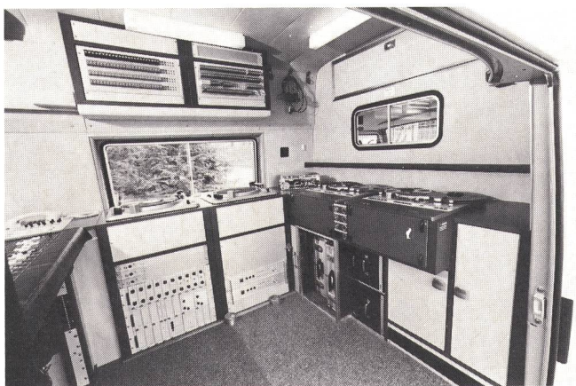
Fig. 4 Geräteanordnung, rechts vom Einstieg her gesehen — Disposition des équipements, à droite de la porte d'accès

Les tableaux de raccordement pour les circuits de modulation et le courant fort se trouvent à la partie arrière du véhicule (fig. 5). On y a également logé les bobines de câbles et les trépieds pour microphones. Le compar-