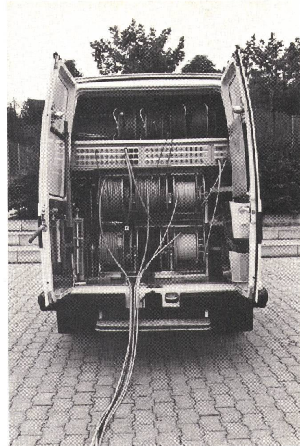
Fig. 5 Fahrzeugrückteil mit Kabelrollen und Anschlussfeldern — Partie arrière du véhicule avec compartiment des câbles et tableau de raccordement

Im Fahrzeugrückteil (Fig. 5) sind die Anschlussfelder für Modulation und Starkstrom sowie die Kabelrollen und Mikrofonstative untergebracht. Das entsprechende Gestell bietet Platz für sechs elektrisch angetriebene Kabelrollen (Fig. 6). Zwei davon enthalten je 50 m Netzanschlusskabel 3 \times 2,5 \text{ mm}^2 und drei je 50 m Mikrofonmehrfachkabel 12 \times 2 + s . Eine Rolle ist mit 100 m Z-62-15 \times 2-Kabel für den Anschluss des Wagens an das PTT-Netz versehen. Im weiteren sind drei kleine Hand-