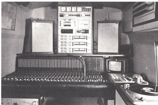
Fig. 7 Mischpult mit der aufgesetzten Matrix 24 \times 24 . Rechts und über dem Mischpult sind die Kontrollgeräte ersichtlich — Pupitre de mixage avec matrice 24 \times 24 mise en place. Les équipements de contrôle sont visibles à droite au-dessus du pupitre

La matrice 24 \times 24 placée en amont du pupitre permet de réaliser d'autres prégroupes. En outre, pour des pro-