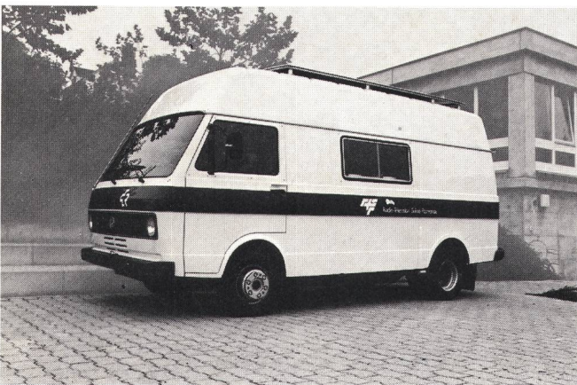
Fig. 1 Fahrbereiter Radio-Reportagewagen — Voiture de reportage prête à prendre la route

An ihrer Sitzung im Mai 1978 beschloss die paritätische Kommission PTT/SRG, im Jahre 1981 drei neue, stereotaugliche Reportagewagen herstellen zu lassen und diese den Radiostudios Basel, Lausanne und Lugano anzugliedern.