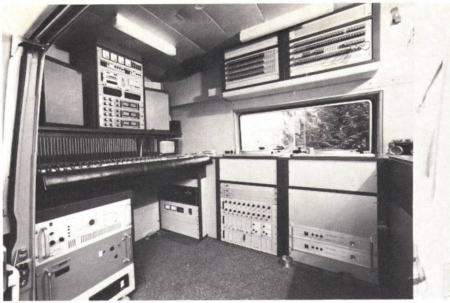
Fig. 3 Geräteanordnung, links vom Einstieg her gesehen — Disposition des équipements, à gauche de la porte d'accès

Kommunikationseinheit untergebracht. Unter der Pultebene sind die schweren, selten oder gar nicht zu bedienenden Geräte eingebaut (Fig. 3).