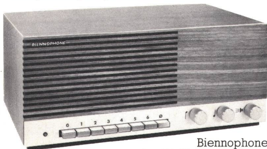
Biennophone das TR-Gerät mit Klasse