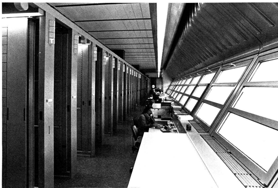
Die interkontinentale Zentrale ist die erste mit dezentralisierter Microcomputersteuerung

Damit die bisher beschriebenen Vermittlungsausrüstungen überhaupt zum