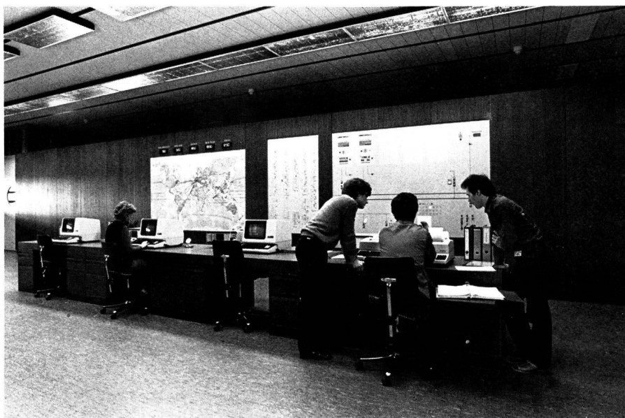
Anzeige- und Bedienungselemente am zentralen Überwachungstabelleau