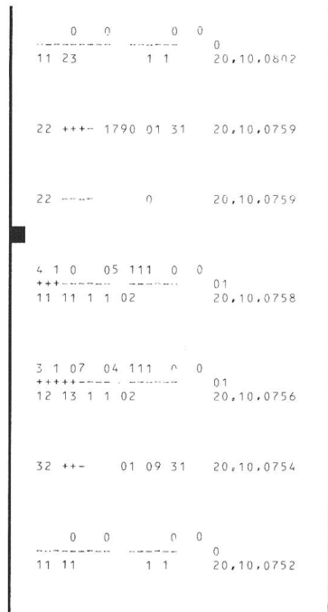
Fig. 3 Muster eines automatischen Fehlerausdruckes auf Endlospapier Système d'impression automatique des défauts sur papier sans fin