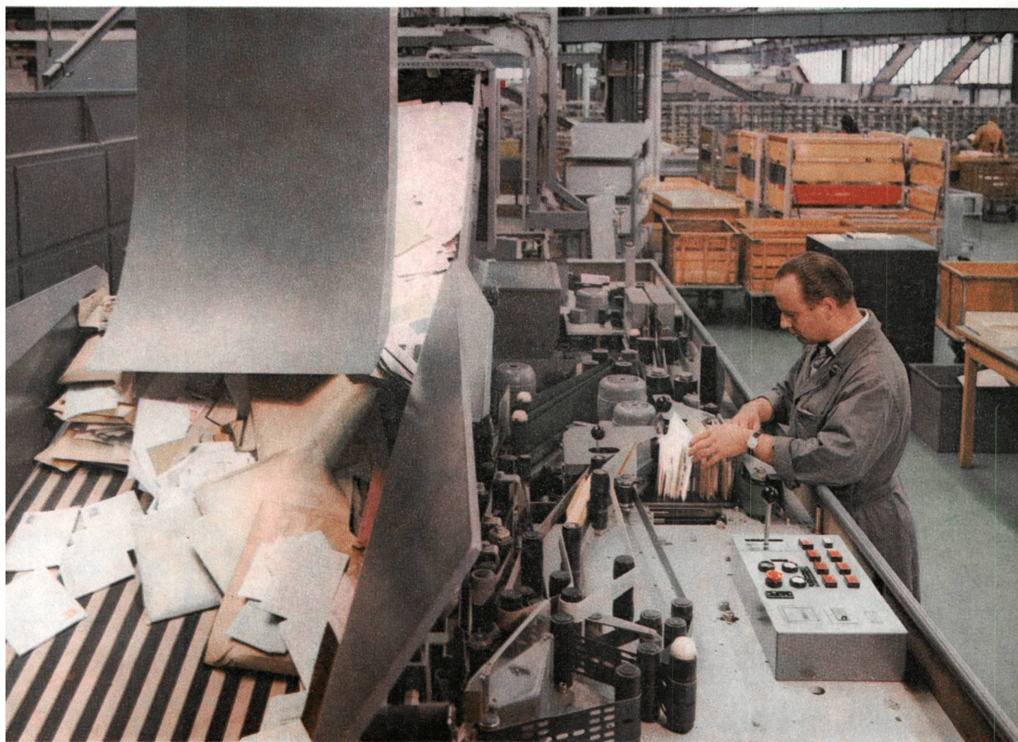
Die mechanische Briefbearbeitung in der Schanzenpost Bern Le tri mécanique des lettres à la Schanzenpost Berne