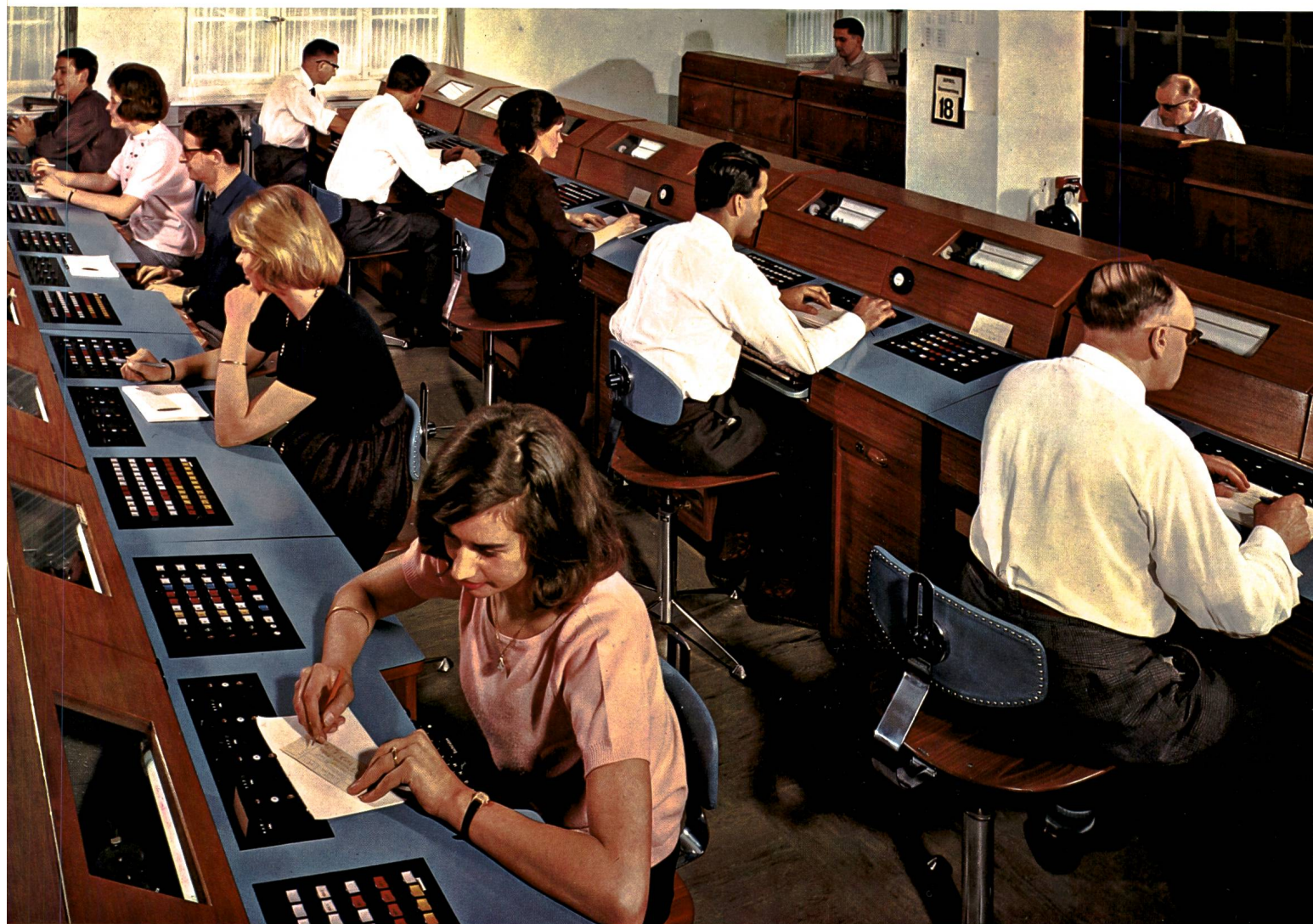
Vue partielle de la position télex intercontinentale de Radio-Suisse SA à Berne