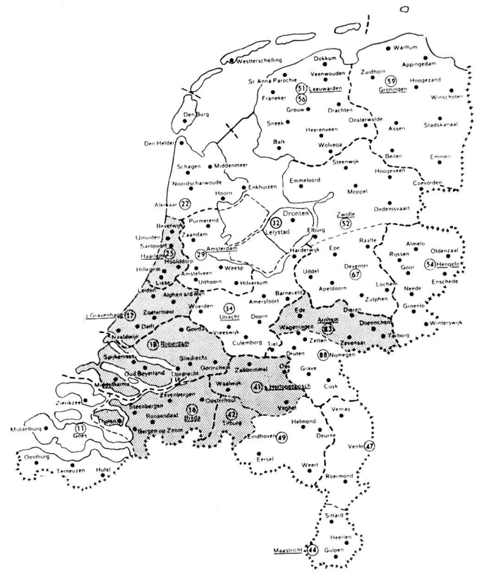
Fig. 2. Die Aufteilung der Niederlande in Telefonnetzgruppen und Zentralsysteme

der interurbanen Gespräche erfolgte bis 1950 auf Grund der geraden Luftlinie. Nach 1953 bestanden fünf Tarifzonen für die Distanzen von 0-10, 10-15, 15-25, 25-35 und weiter als 35 Kilometer. Die Tarifänderung von 1954 ordnete jedem Sektor eine durch einen Minuten-Zählimpuls bestimmte Taxe zu, so dass schliesslich drei Taxazonen A, B und C geschaffen wurden. Die Zone A umfasst den interurbanen Verkehr des eigenen Sektors sowie den Verkehr der Sektoren unter sich, und zwar bis zu einer Entfernung in gerader Linie von höchstens 10 km. Die Zone B umfasst den Verkehr zwischen den Sektoren, wobei die Distanz zwischen den Knotenämtern zwischen 10 bis 25 km liegt. Der übrige Verkehr wird nach dem Tarif der Zone C berechnet.