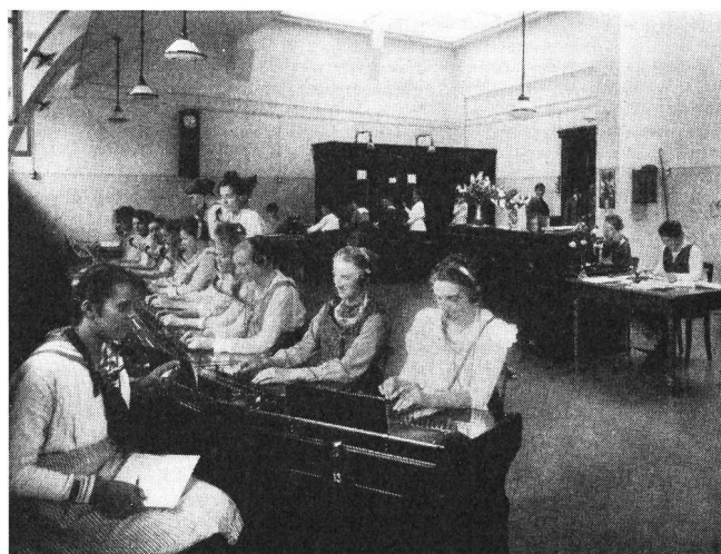
Fig. 2. Halbautomatische Zentrale Hottingen I (1917)

Nachdem gegen Ende 1917 die ersten Kinderkrankheiten des neuen Systems überwunden waren, zeigte sich bereits, dass die Telephonistinnen, die in der Stunde 500 Anrufe zu beantworten hatten, mit der Präzision der Apparaturen nicht Schritt zu halten vermochten. Das ist kein Vorwurf; der menschlichen Arbeitskraft sind aber irgendwo Grenzen gesetzt. Der weitere Ausbau der An-