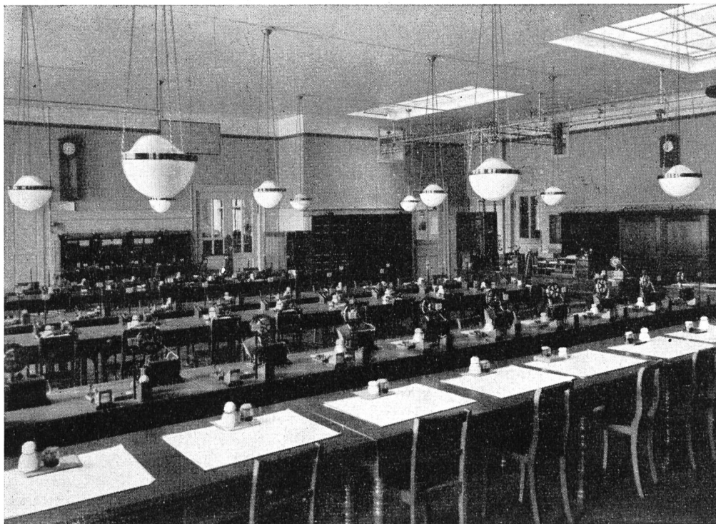
Abb. 24. Morse-Saal Zürich 1924.

1900 die Verbindungen 33a, Zürich—London, und 33b, Zürich—Wien. 1902 beantragte Frankreich den Bau der Leitung Paris—Zürich.