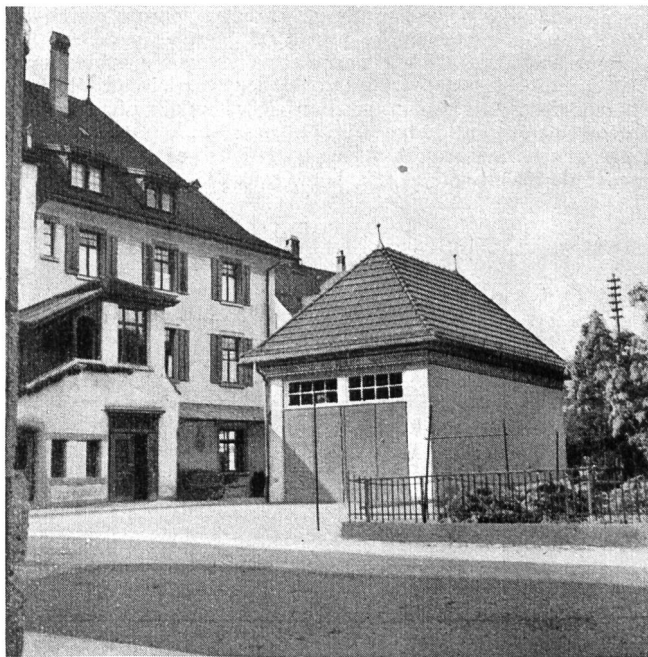
Abb. 1. Vor dem Umbau.

Für die Kabelzuführung ist eine kurze Rohrleitung mit Anschluss an die durchgehende Rohranlage St. Gallen-Wil-Zürich in der Hauptstrasse erstellt worden. Beides, Rohrleitung und Automatenlokal, wurden auf den Herbst 1939 fertig. So konnten im Winter 1939/40 die Kabel unter tunlichster Ausnützung be-